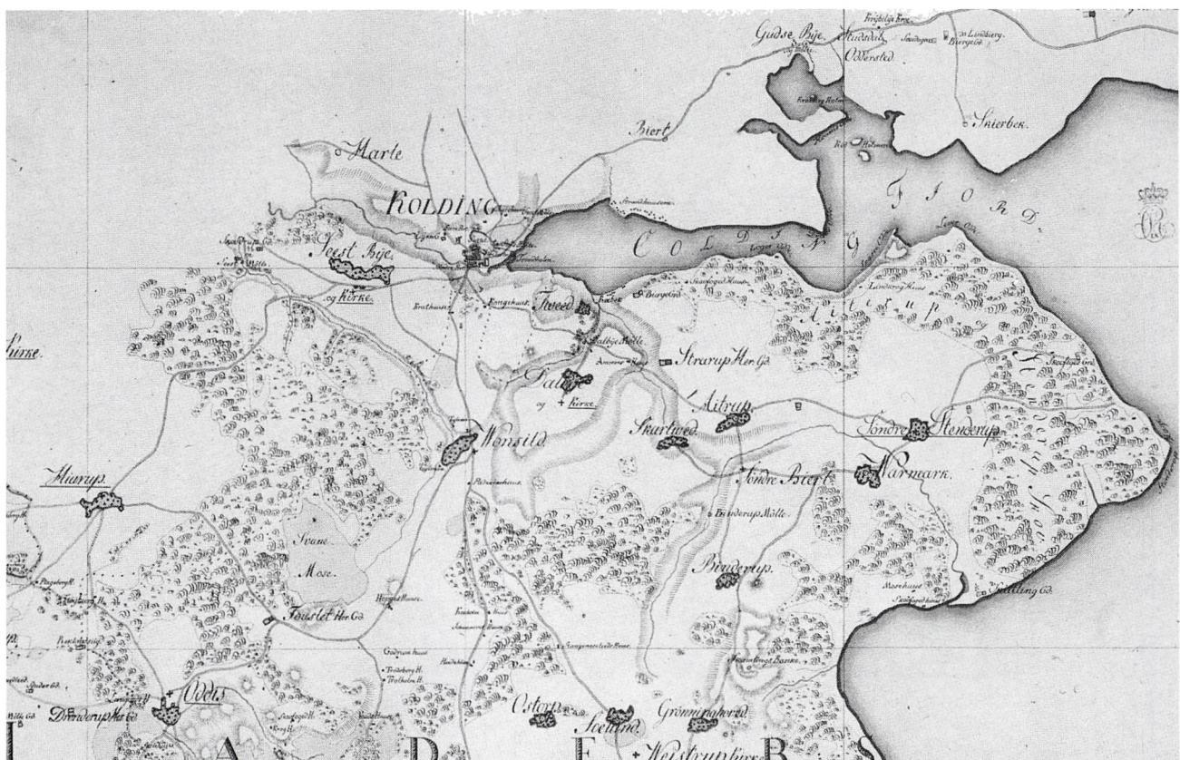
Kort over den nordøstlige del af Nordslesvig fra 1804 i Dronningens håndbibliotek.