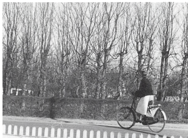
Æ sygeplejersk' på den uundværlige cykel.

I lang tid hjalp jeg en meget skrøbelig gammel kone i Lilballe. Hun boede hos en ugift datter, eller omvendt. Selv om hun blev passet godt af datteren, gav