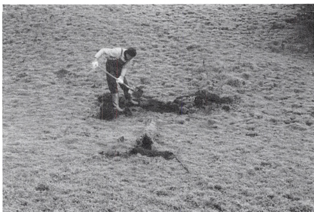
Udløbet fra træørere'.