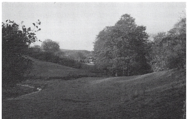
Alpedalen. I midten ses træstammen. I begge sider af billedet fornemmer man saltmøllekanalens spor.