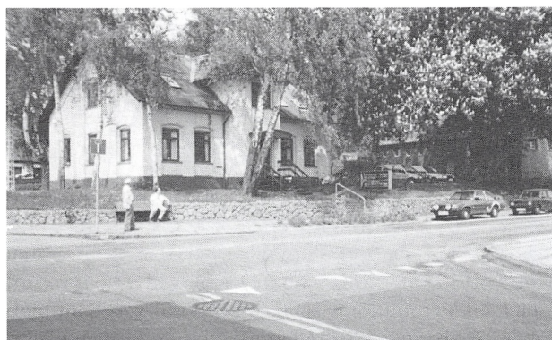
Skinderborghavegaard's stuehus 1990. Udvendig har stuehuset ikke undergået større ændringer i de ca. 100 år, indvendig er det blevet indrettet til kontorbrug. I baggrunden vestlængen.

utvivlsomt med det »borg«, vi kender fra f.eks. Viborg, d.v.s. bjerg, banke.