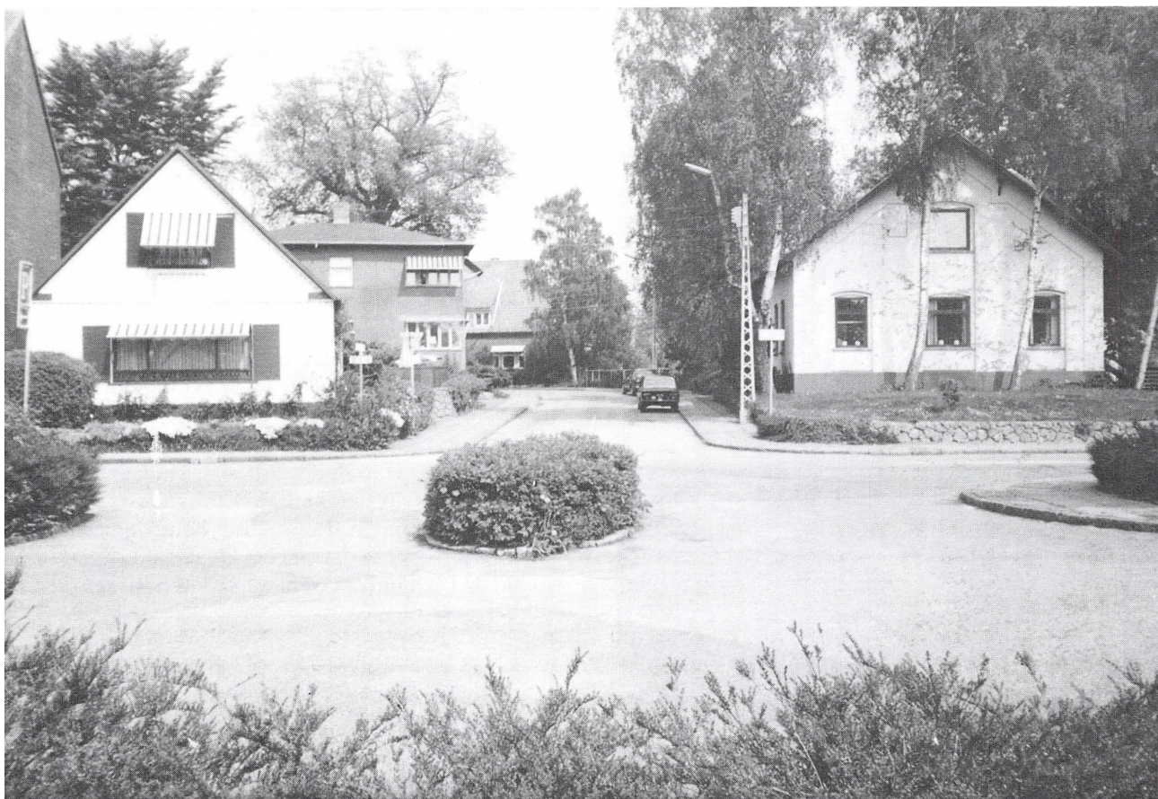
Gårdspladsen på Skinderborghavegaard. Gårdens oprindelige bindingsværkshuse, sammenlign brandtaksationen 1790, er blevet afløst af moderniserede bygninger, t.h. stuehuset, t.v. vestlængen, den lille bygning mod nord har ikke efterladt sig spor. Gårdspladsen udgør i dag det første stykke af A.D. Burcharths Vej. (Foto: Jytte Crüger).

to brødre har kunnet arbejde sammen ved opførelsen af Skinderborghavegaard. De er måske også flyttet ind i det nye hus sammen. I 1761 boede de begge i Kolding, i 1771 ingen af dem.