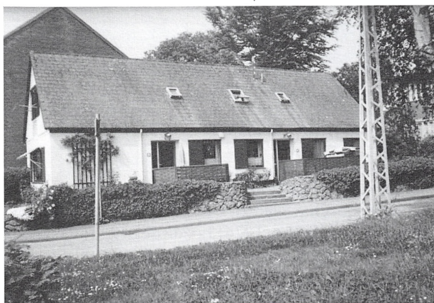
Skinderborghavegaard's moderniserede vestlænge A.D. Burcharths Vej 1-3, 1990. I den er der indrettet 2 lejligheder.