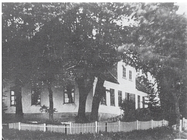
Skinderborghavegaard's stuehus ca. 1895, Fredericiagade 13.