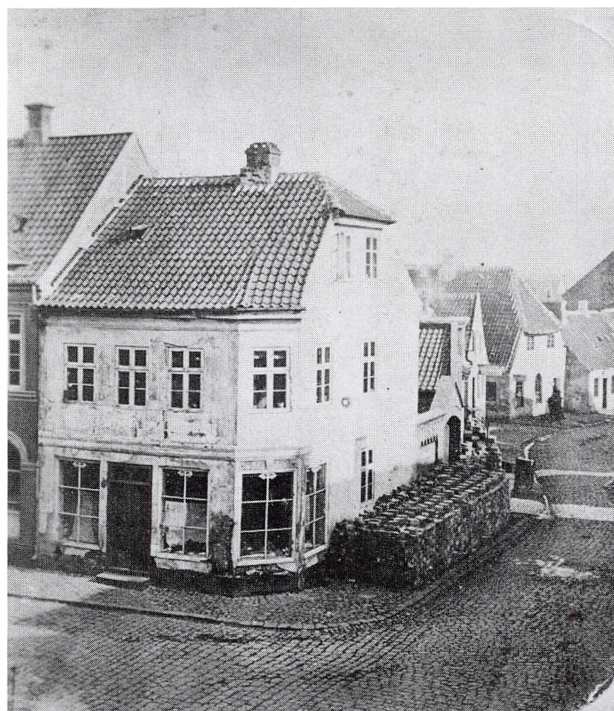
Hjørnet af Østergade og Helligkorsgade i 1872. Det ses, at sygehusbygningen på dette tidspunkt er nedrevet. Den lå der, hvor porten med den spidse overbygning ses.