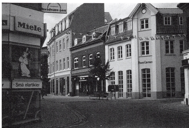
Helligkorsgade nr. 17 (Eriksens Salon), efteråret 1990. På dette sted lå det første amtssygehus i Kolding.