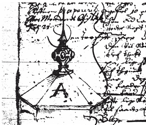
Udkast til trappespir i Koldinghus Lensregnskab 1653/54.

Efter at 15 boelsmænd havde brugt en dag på at rengøre samme store sal, blev den snart taget i brug, mandag den 7. marts, til et møde for hele den jyske adel, der skulle lade sig taxere for, hvor mange heste de skulle holde til rigets tjeneste. Søndagen forud blev der slæbt øl, men ellers har dette opbud ikke – udover ren-