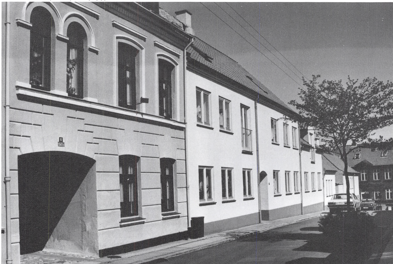
Langelinie med nyt »udfyldningsbyggeri«.