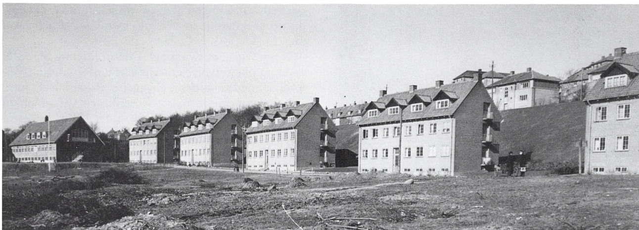
Foto fra 1945, da AAB var færdig med en række etageejendomme på Vifdam. I baggrunden til højre skimtes de første huse på Nordre Ringvej.

8 ejendomme med tilsammen 32 lejligheder, som der i denne omgang er bevilget statslån til. Det er foreningens agt at fortsætte byggeriet i det omfang, hvor forholdene måtte gøre det nødvendigt, forsvarligt og påkrævet, og såfremt tanken vinder fornøden tilslutning blandt arbejderklassen.«