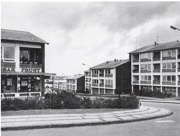
Snerlevej med butikker ud til Agtrupvej, opført 1955-58.

moderne lejligheder voksede kraftigt og udmøntede sig i lange medlemslister, så der skete hurtig udlejning af de følgende 589 lejligheder, som kom til at ligge i Hestehaven, Brændkjærgade og Snerlevej/Agtrupvej. I 1950-60 foretoges også byggeri af en helt anden art, nemlig Vifdam Børnehaven, efter aftale med kommunen. I 1959-60, var bilismen tiltaget så meget, at det var utilstrækkeligt med parkeringsarealer i det fri, derfor kom det første garagebyggeri: 56 stykker ved Brændkjærgade.