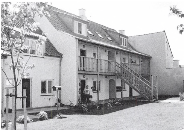
AAB er godt med i byfornyelsen — her et par af husene i Borgergade.

løst i Låsbygade, Katrinegade, Zahnsgade, Blæsbjerggade, Langelinie og Vesterbrogade. En af de større indsatser på dette område blev den nye bebyggelse med 66 lejligheder mellem Låsbygade og Vifdam.