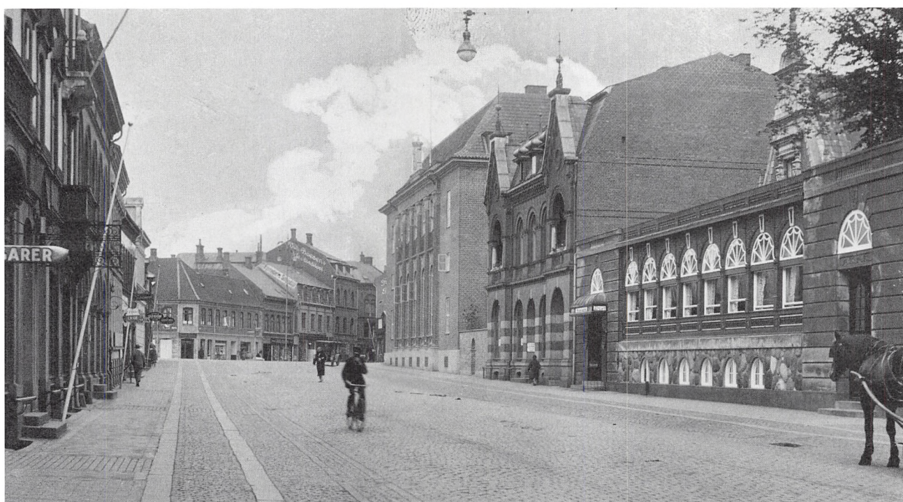
Jernbanegade i 1920'rne.