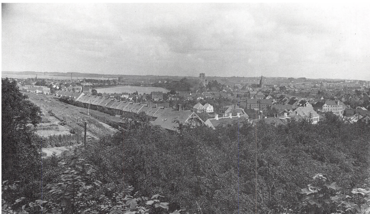
Kolding fra nordvest ca. 1930.