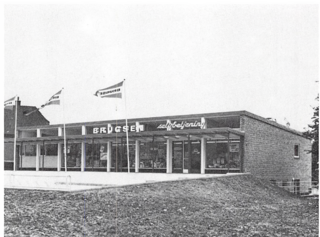
Brugsen på Agtrupvej.