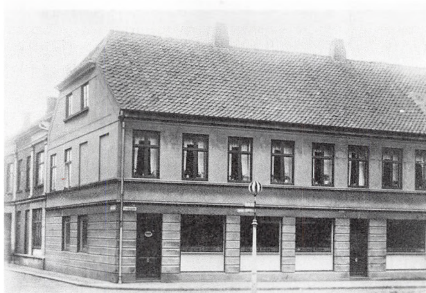
Forretningen i Låsbygade som den så ud i 1930'rne.

»Diskussionen om eventuel Oprettelse af Fællesbageri og et Par andre Punkter var saa langvarig, at man ikke nåede at blive færdig, før det elektriske Lys i Salen paa Hotel Fremad var slukket, saa Forhandlingen matte fortsætte med Anvendelse af Tællepraase og Petroleumslamper«.