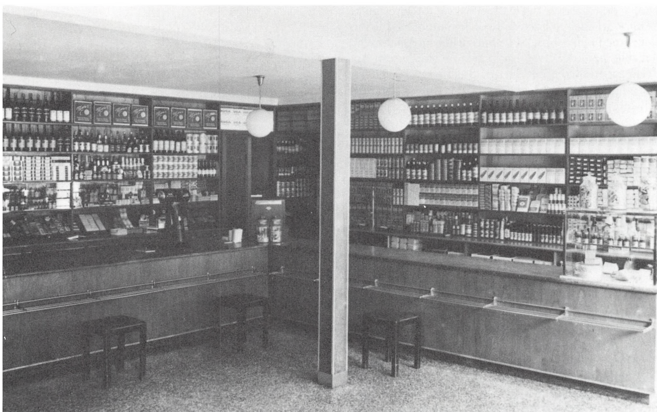
Brugsen i Låsbygade efter moderniseringen i 1948.

virkelig nødvendigt at klodse bilen op og ty til anvendelse af hestekøretøj.