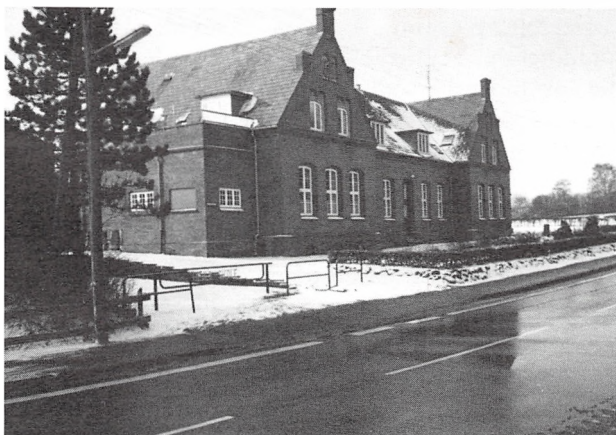
Efterskolen i Hejls.