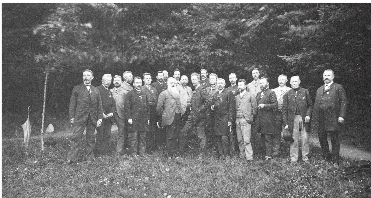
De samvirkende sønderjyske foreningers overbestyrelse 1891 på Skamlingsbanken.

virkelig battede, hvor hjælp var nødvendig. Koldingforeningen var ikke blandt de få, der skejede ud – heller ikke med de mange bøger til Sprogforeningen. Det var kun pengene, der skulle rundt om København.