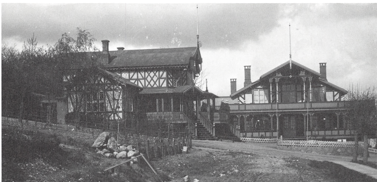
Forlystelsesetablissementet Alhambra ca. 1900. Her fandt mange af foreningens arrangementer sted.

efter kaffen »spillede Musikken op og saavel ældre som unge Medlemmer dyrkede Dansen i nogle Timer«, og samme år holdt foreningen julebal på Industrien.