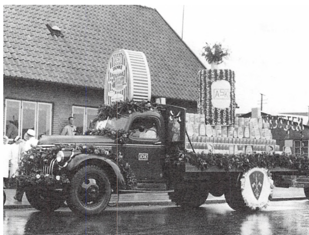
ASK' vogn til fagenes fest 1956.