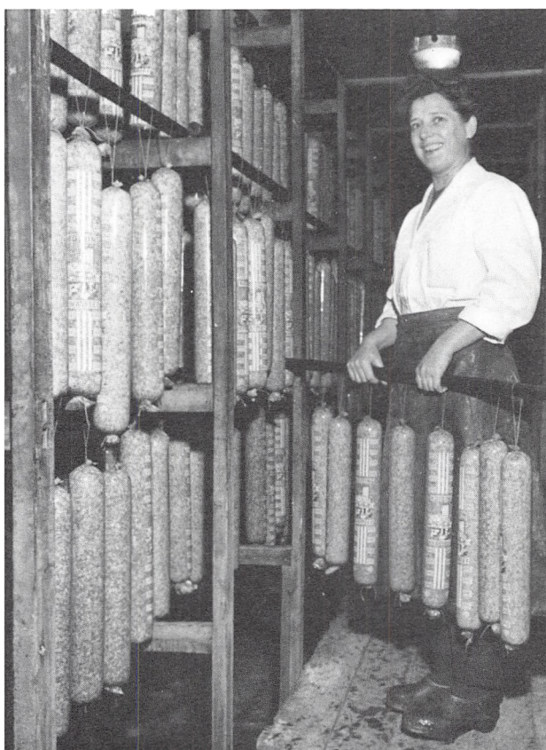
Pølser fra ASK 1962.