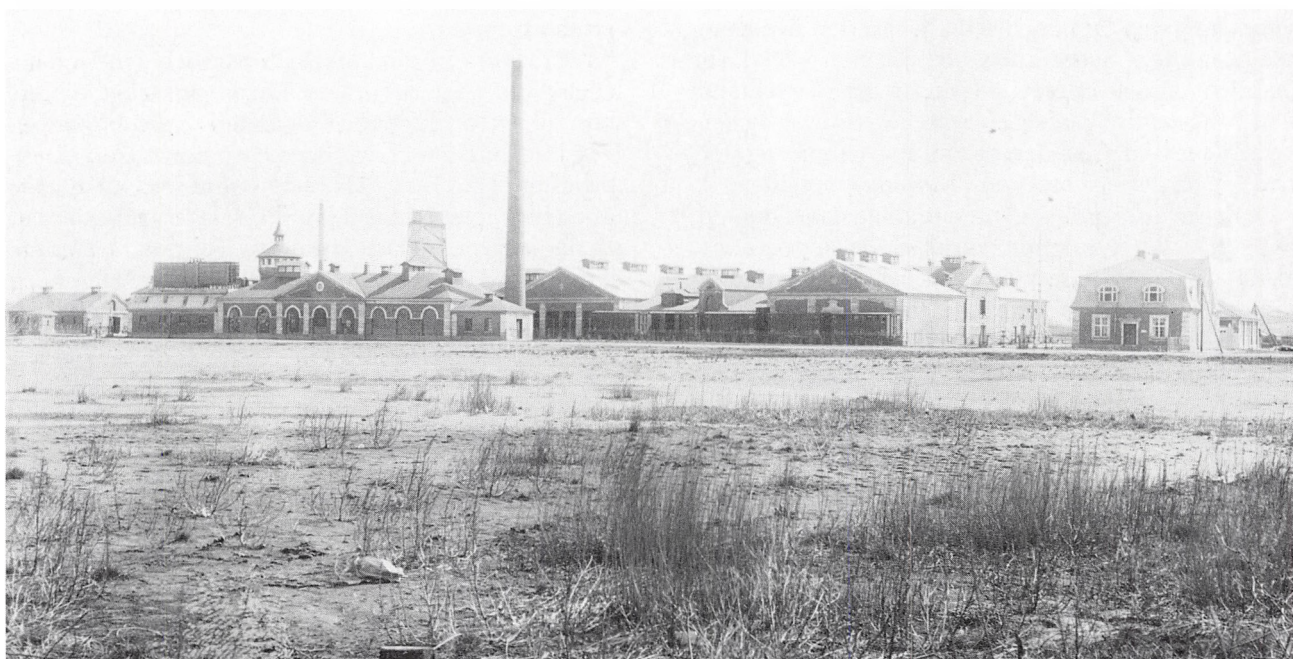
Andelssvineslagteriet ca. 1920.

Indtil 1937 behandledes alt blod ved kogning og tørring i tromler til blodmel til foderbrug. Man eksperimenterede med en bedre behandlingsmåde og i 1937 skred man til anlæg af en blodalbuminfabrik, og atter som det første sted her i landet. Man pumpede såvel svine- som kreaturblod direkte fra slagtehallerne til albuminfabrikken, hvor det først »knustes« i en slagmølle, derefter inddampedes det i vacuum, og endelig tørredes det koncentrerede blod i forstøvningsanlægget til et fint, let grynet pulver. Produktet »albumin« er i modsætning til det almindelige blodmel vandopløseligt og anvendes hovedsageligt til limning