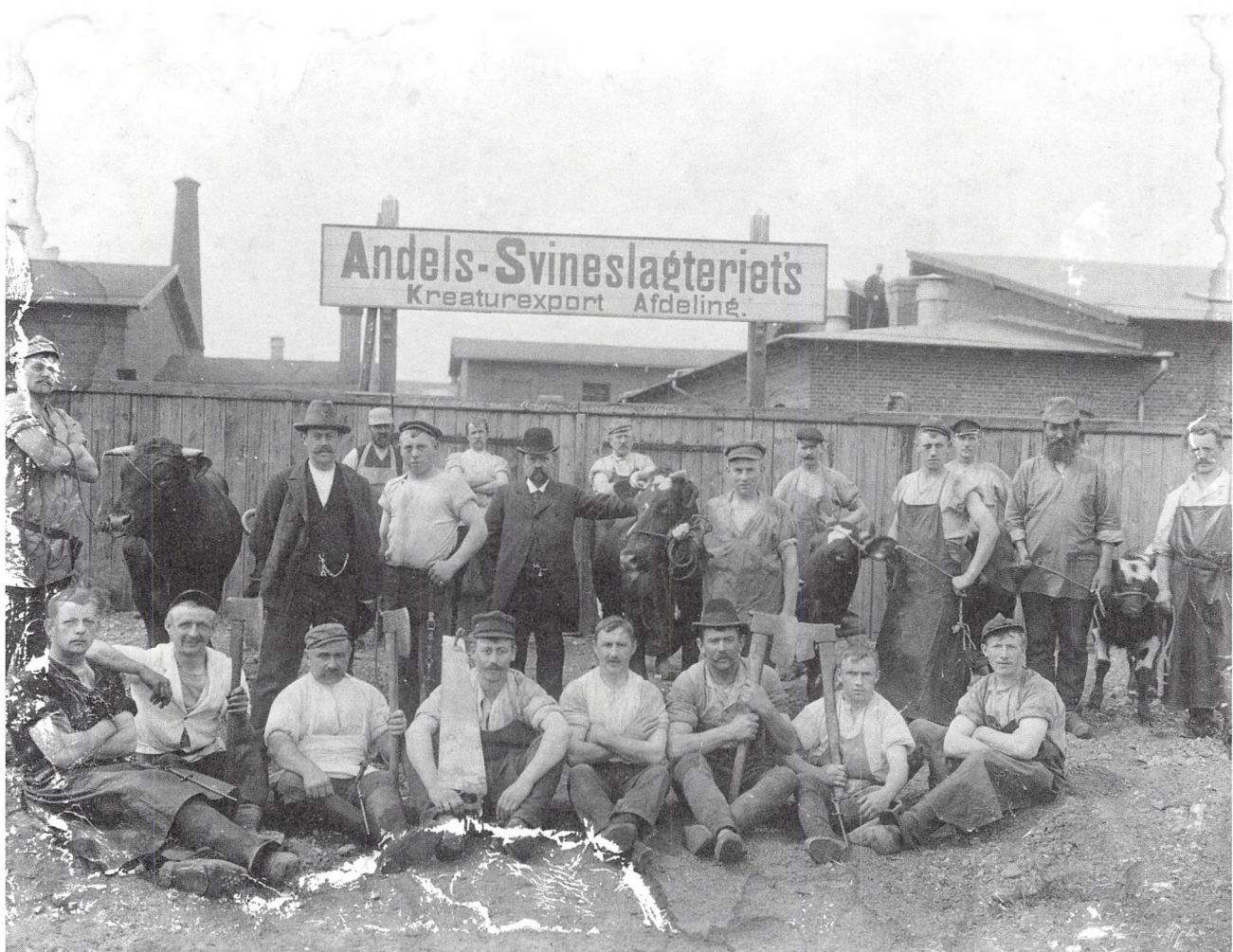
Andelssvineslagteriets kreatureksportafdeling 1900.

ekspropriation af en del af grunden, blev man enig med DSB om at sælge grunden for 150.000 kr. til dem.