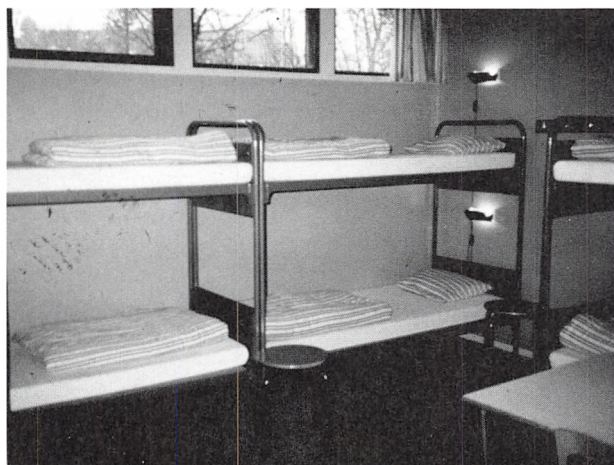
Familierum, 1988.

Både fra Herbergsringens side og lokalt gjorde man i de følgende år meget for at gøre opmærksom på vandrerhjemmets eksistens. Herbergsringen nedsatte et propagandaudvalg og et lejrskoleudvalg, det sidste for især at gøre opmærksom på, at vandrerhjemmene var velegnede til at modtage lejrskoler, der blev stadig flere i disse år. Ved at udnytte forårs- og efterårsmånederne til lejrskoler håbede vandrerhjemmene