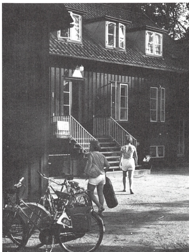
Cyklister ankommer til vandrerhjemmet, ca. 1960.

Selv om de motoriserede havde fået adgang til vandrerhjemmene, lå overnatningstallet også relativt lavt