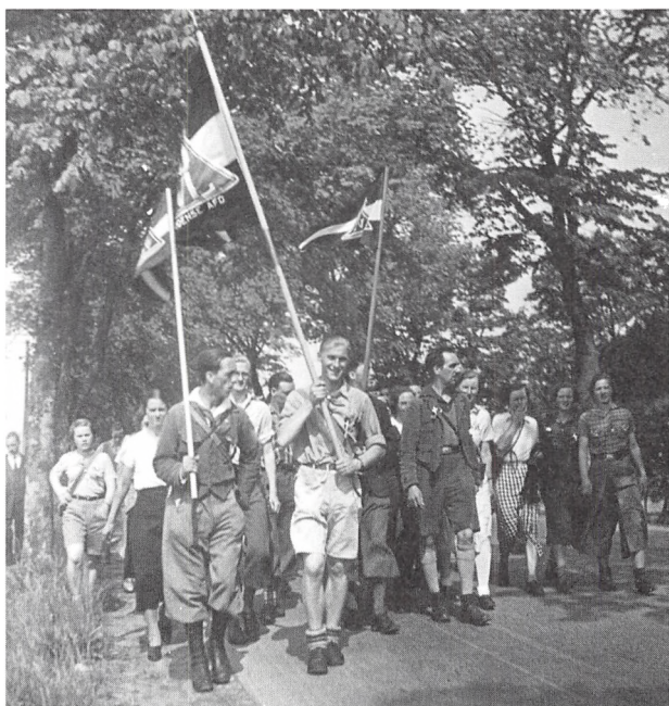
En flok vandrere fra slutningen af 1930'erne.