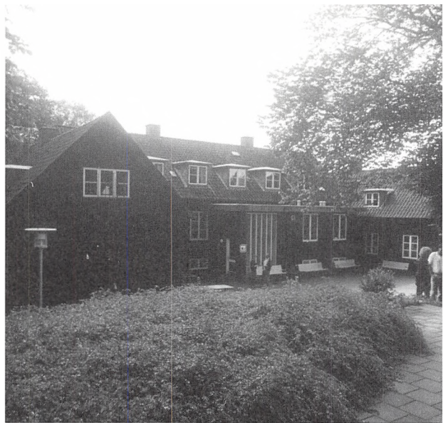
Kolding Vandrerhjem. Hovedbygningen set fra annekset, 1988.

En konkurrent til vandrerhjemmet har i de senere år også været den private udlejning af værelser til turister. Over for dette er argumentet for at vælge vandrerhjemmet det samme som det var for 50 år siden: Vandrerhjemmet er ikke blot en seng at sove i, det er et hjem, hvor alle kan føle sig velkomne, hvor der er ordnede forhold, og hvor der er stor mulighed for at komme i kontakt med andre mennesker fra mange forskellige nationer og dermed få større viden om andres livsvilkår.