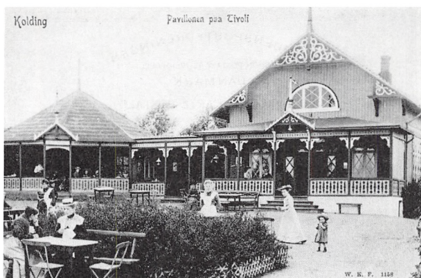
Traktørstedet „Tivoli”, ca. 1900.

drerhjem. Der var mange ungdomsorganisationer i 1930'ernes Kolding, bl.a. Dansk Vandrerlaug, D.U.I., Kolding Ungdomssamfund, Blå Kors, Det danske Pigespejderkorps, Det danske Spejderkorps, Frivilligt Drengeløbsforbund, KFUM og K-spejderne og de politiske ungdomsorganisationer D.S.U., K.U., R.U. og V.U.