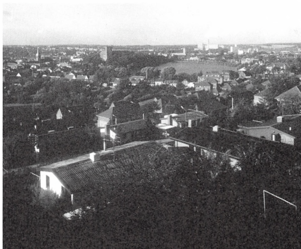
Udsigt fra Kolding Vandrerhjem, 1988.

Det var som nævnt byens ungdomsorganisationer, der stod bag initiativet til oprettelse af Kolding Van-