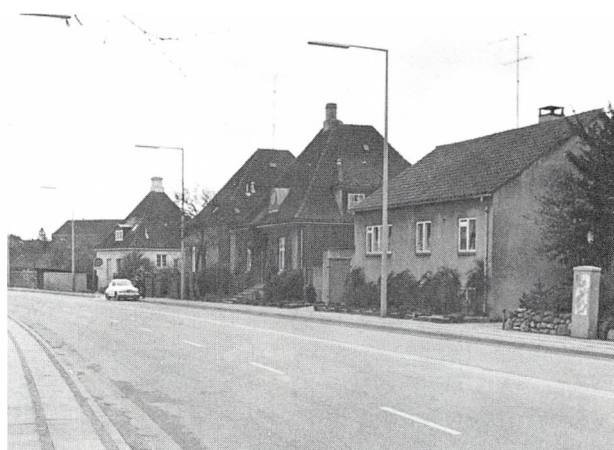
Slotssøvejen nr. 1 (med bil parkeret foran), nr. 3, nr. 5 og nr. 7, ca. 1980.

Da mageskiftet mellem kirkeværge Hansen og rektoratet fandt sted i 1836, ansattes værdien af matrikel nr. 228, som vi har set, til 100 rbd., i 1855 anslog rektor Ingerslev i en skrivelse til ministeriet værdien til 1.000 à 2.000 rbd., og kammerråd Thomsen købte den for 2.650 kr. i 1876. Ved ejendomsvurderingen ca. 100 år senere i 1970 blev den samlede grundværdi af matriklen sat til 251.900 kr., i 1986 var den steget til 1.385.000 kr., men så ligger alle ejendommene også »så smukt ved Kolding Sø«.