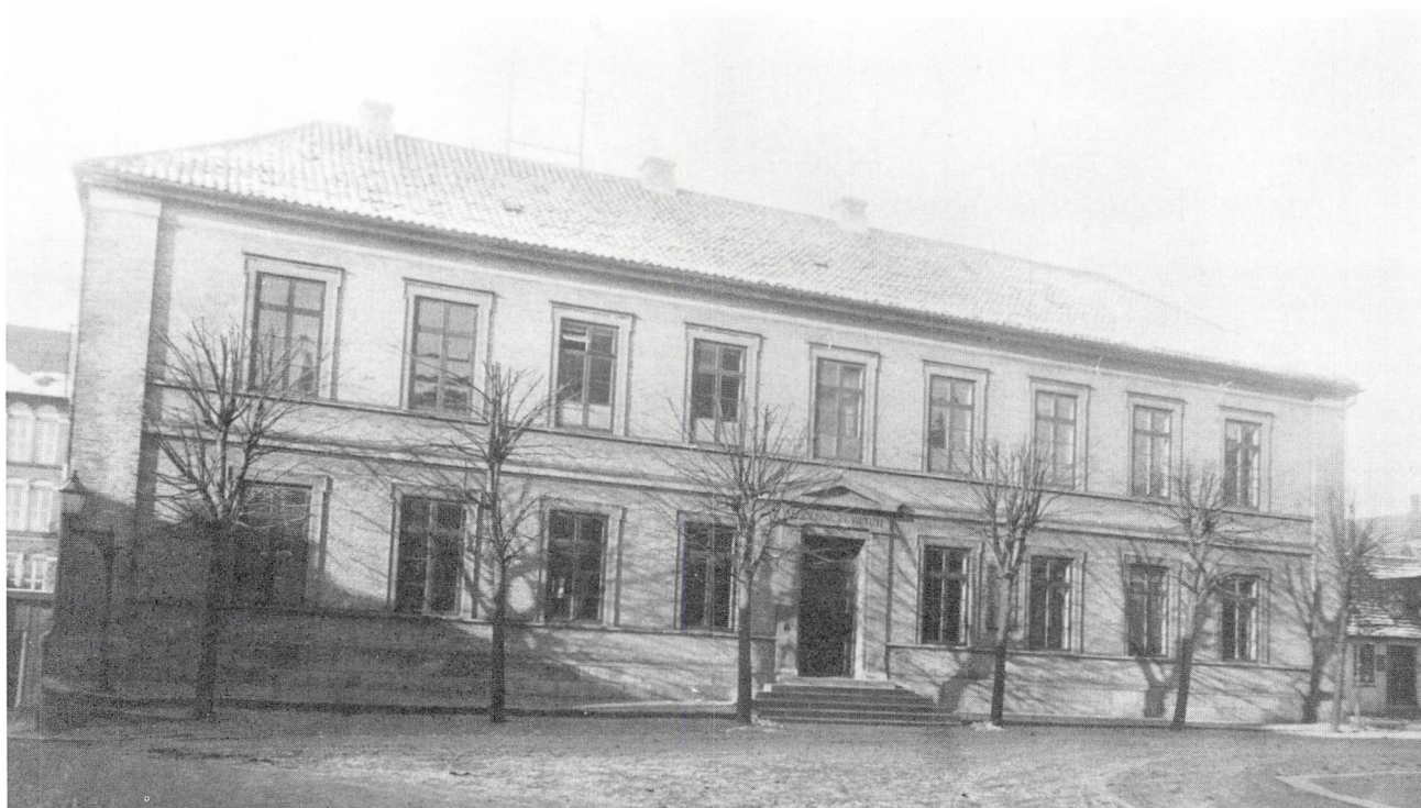
Kolding Latin- og Realskole. Fotografi 1902.

Men var det sket? Vi ved det ikke; det omtales kun i de tre ovenfor citerede skrivelser. Haderslev lærde Skole, opført 1853, fik sit kongelige monogram over hovedindgangen; og på arkitekttegningerne til latinskolerne i Horsens og Randers, bygget i 1857-58, er det anbragt tilsvarende. Måske har da også Kolding lærde skole haft sit kongelige navnechiffer, men i så fald antagelig kun fra 1846 til 1856, da skolen ophørte med at være statsejendom.