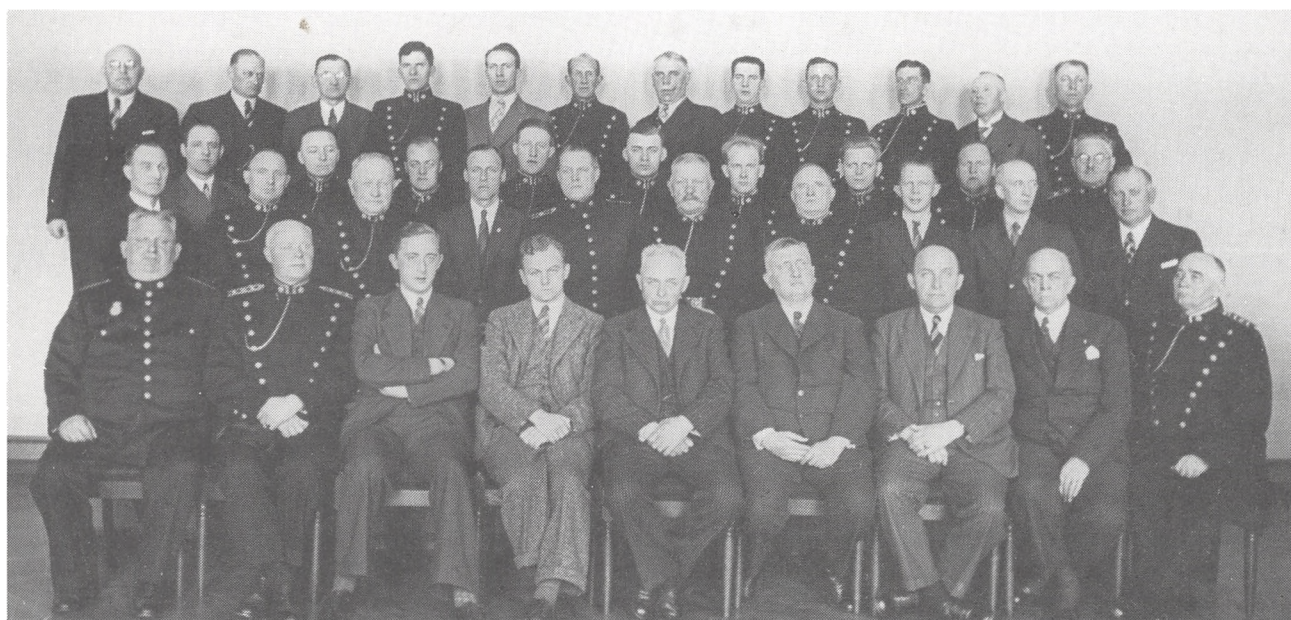
Rigspolitiet i Kolding 1. april 1938.

sagde følgende: »De herrer jager os som om vi var forbrydere. Vi kæmper dog også for, at Danmark kan blive frit igen!« Den sad!