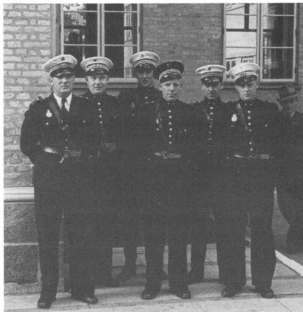
Politibetjente ved Nicolai Plads i begyndelsen af besættelsen.

Endelig gik den 3. ud over havnen – Svineryggen til Jernbanebroen ved Strandhuses vestlige begrænsning. Det hændte, at vi blev inspicerede herude. Det hørte dog hurtigt op, for kollegaen fandt hurtigt ud af, at han havde eftersat en mørk cyklist, som desværre forsvandt for ham. Derfor måtte han