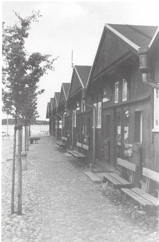
Hagerups eksportstalde genanvendt til marina.

Om Hr. Aubeck havde ret, må vi hver især dømme, flertallet var begejstret.