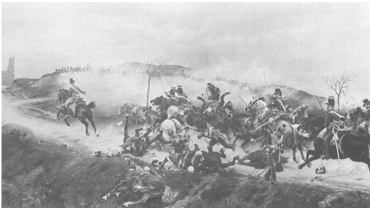
Otto Bache malede på bestilling af brygger Carl Jacobsen dette billede af husarernes angreb på skanserne ved Fynsvej. Maleriet hænger nu i det store trapperum på Kolding Rådhus.

af planen, der skulle have været realiseret af Rye, måtte opgives, bestemte Bülow sig for at afbryde slaget, hvorefter Rye begyndte sit berømmelige tilbagetog gennem Jylland, mens Bülow trak hovedparten af sine tropper via Fredericia tilbage til Fyn.