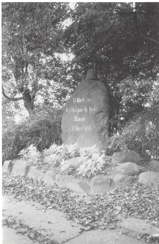
Mindestenen på Fynsvej, afsløret 1899.