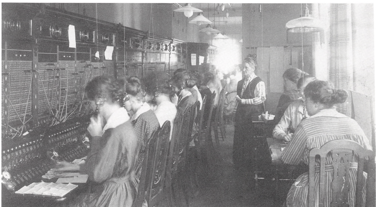
Koldings telefoncentral, Akseltorvet 4, 1901.

Telefonselskabet havde 1896–1921 til huse Akseltorvet 4, nu Handelsbanken.