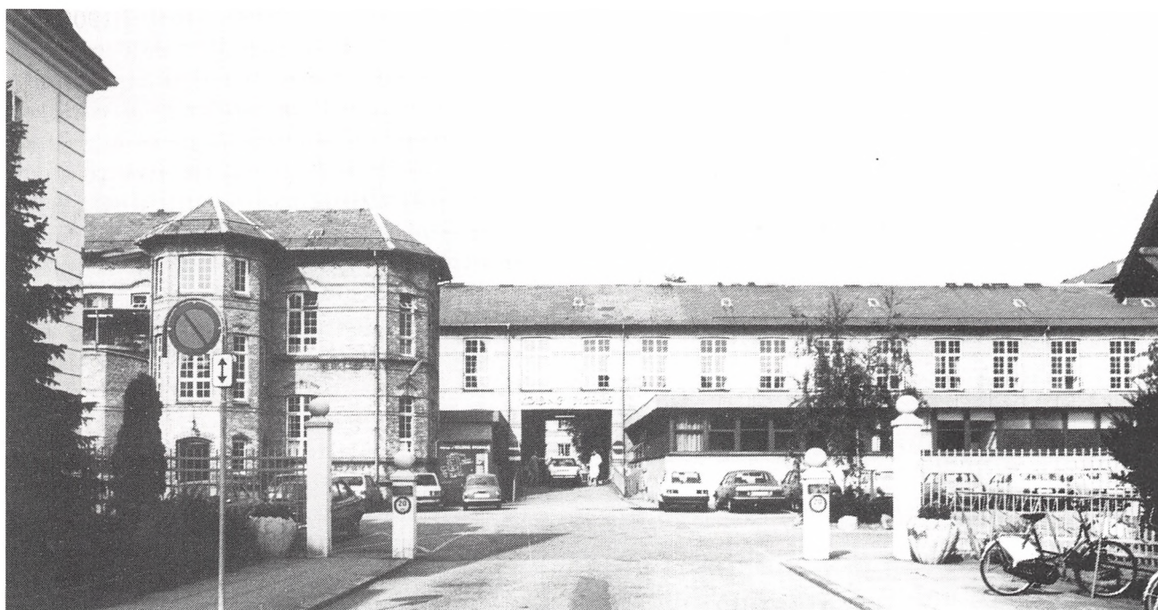
Kolding sygehus set fra Sct. Jørgensgade i august 1984.