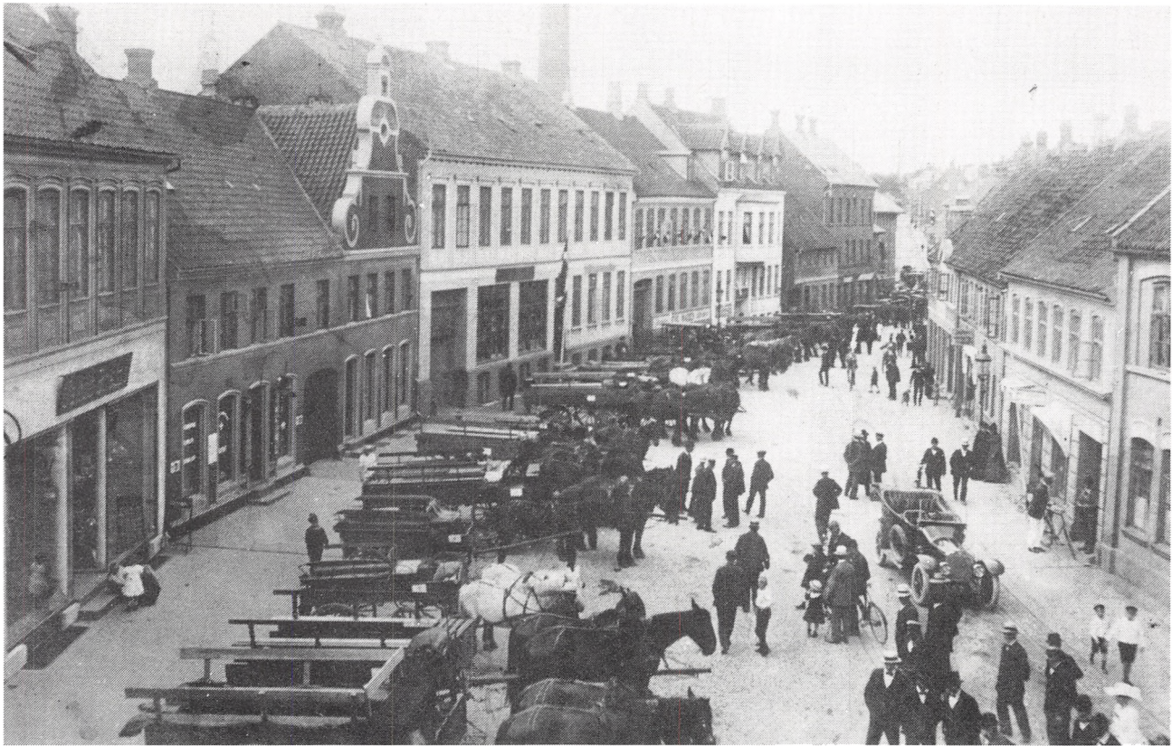
Rendebanen set mod vest ca. 1910. Det store hvide hus i midten af billedet var »Lind og Juhl«, senere KFUK.

vinkælder, og hvis vi var heldige at finde tomme vinflasker, aftog han dem gerne for nogle småører.