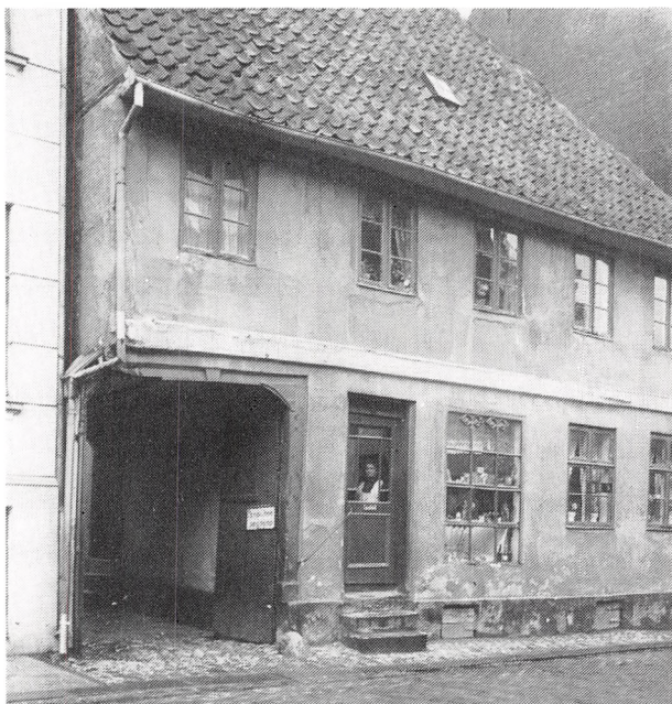
Rendebanen 4 ca. 1915.