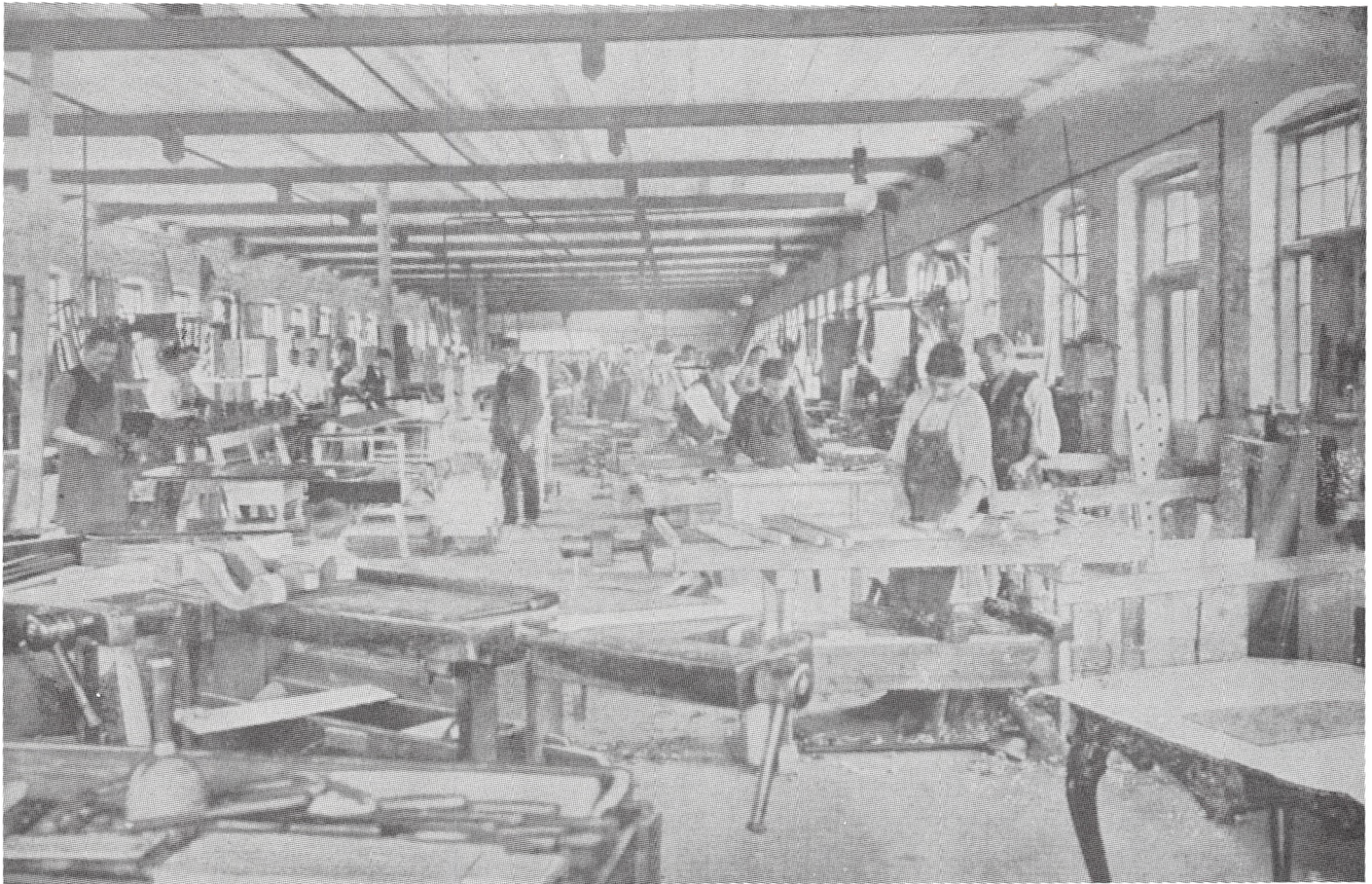
Interieur fra snedkerværkstedet.

dan videre, det hørte med til opdragelsen, og selv ofrene fandt vist denne tingenes tilstand som værende naturlig.