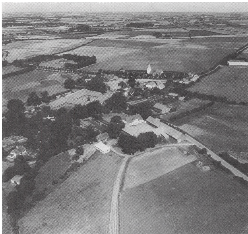
Bramdrup by 1955.

Dengang – for en menneskealder siden – har det nok også for