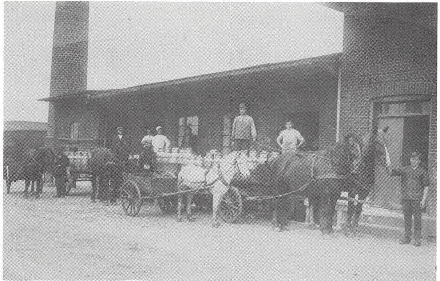
Bramdrupdam Andelsmejeri omkr. 1920.