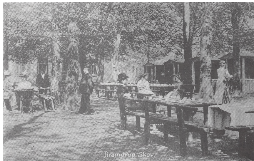
Traktørstedet i Bramdrup Skov. Postkort af fotograf Georg Burchardt, Kolding, ca. 1920.

Burde da ikke milepælen med diverse myndigheders hjælp vækkes af sin tornerosesøvn, nettes lidt og genopstilles i nærheden af dens oprindelige plads – til glæde for den forbipasserende og som et minde om noget fra dengang? – nu, da hækken alligevel er klippet!