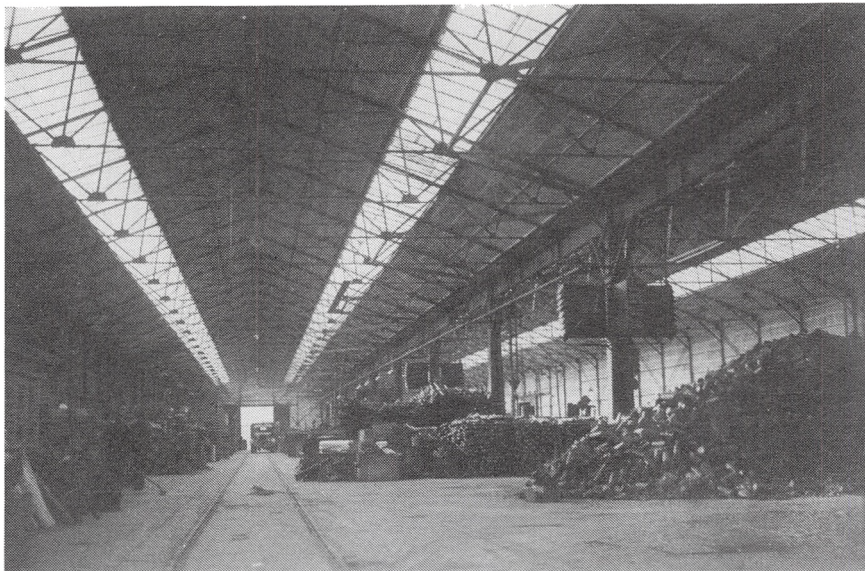
Hallerne på Nordhavnen, sortering af udrustning.

Foruden det, der er blevet beslaglagt, har staten, militæret samt flygtningeadministrationen modtaget effekter. Man anser det for