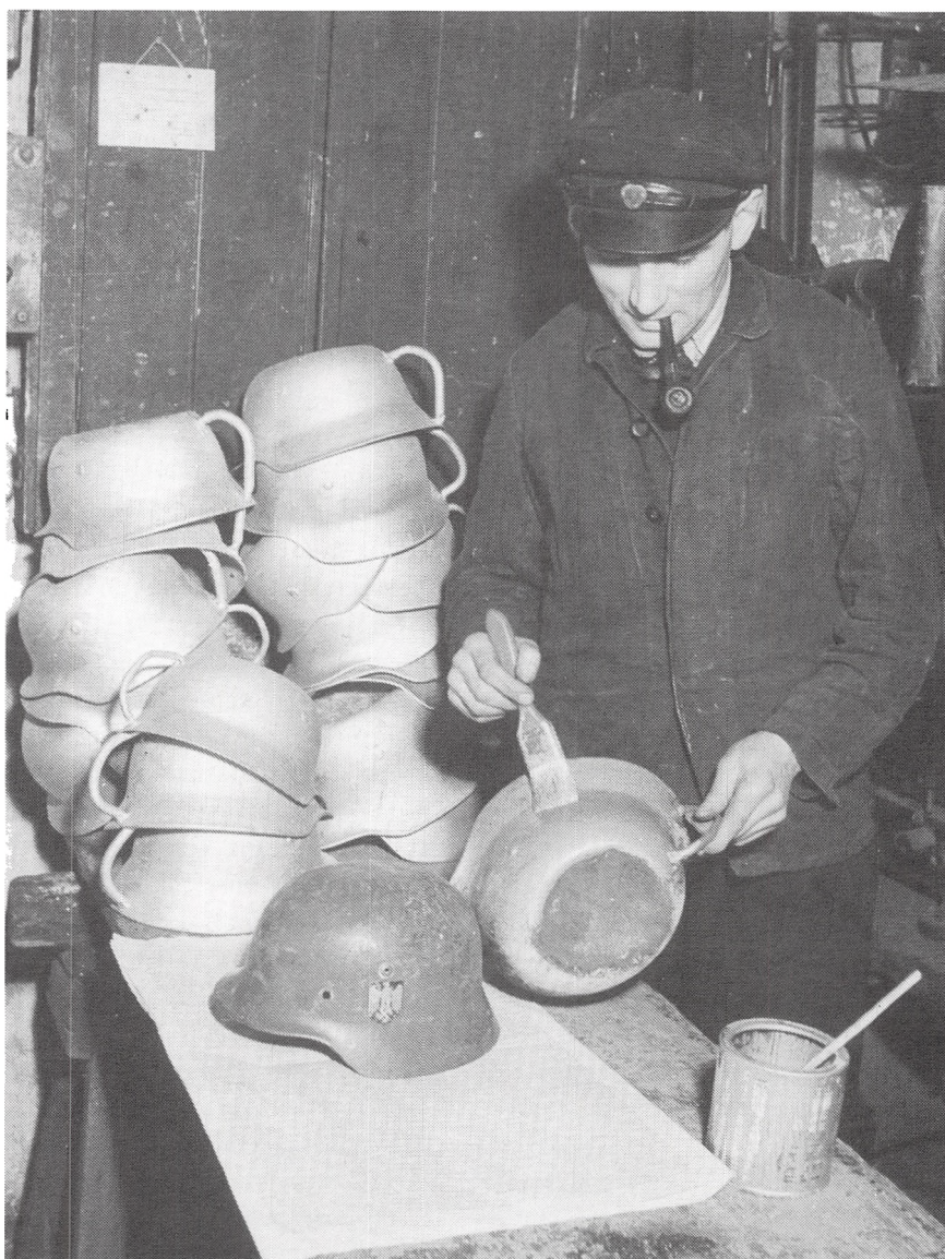
Stålhjelme blev til natpotter.

Flere hundrede personer af alle kategorier var med til at afvikle de tyske efterladenskaber i Kolding og dette blev klaret med et velfortjent »well done«.