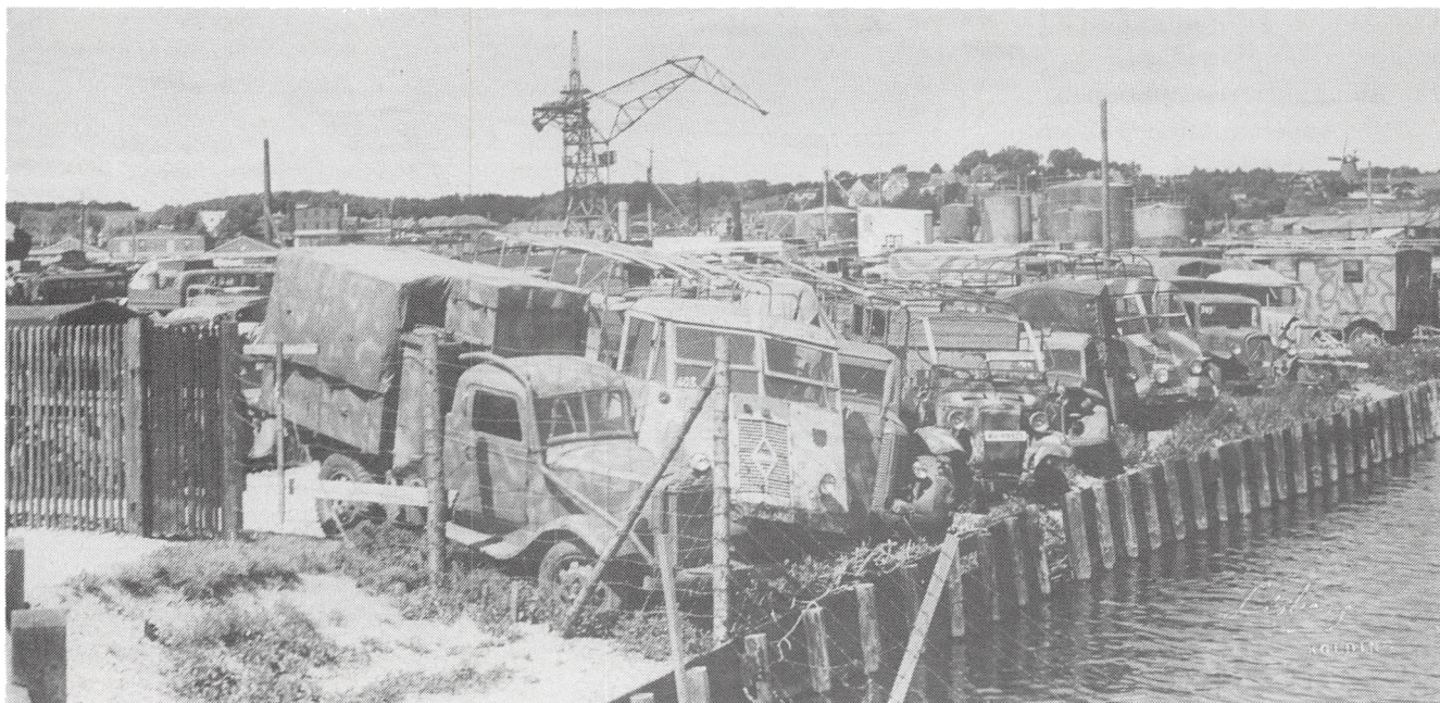
Biler og biltrag på Sydhavnen, foto Lisberg. Havnemesterens kontor.

9/10: Politiet har problemer med den urolige Kolding politikreds. Det hævdes, at Parkkompagniet fungerer som storleverandør til den sorte børs.