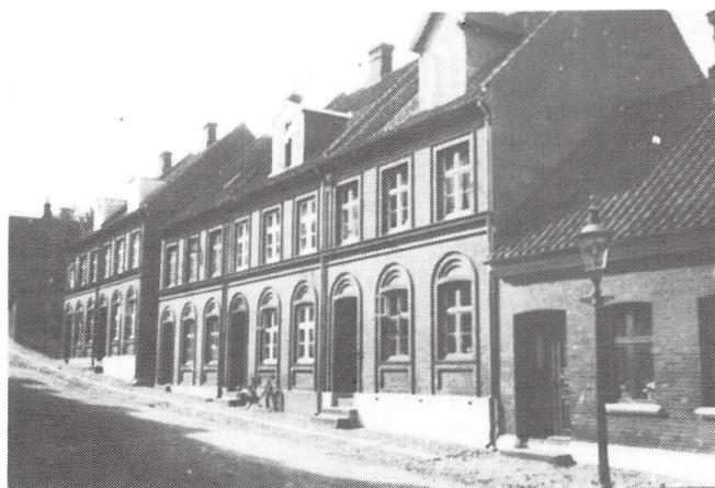
Industriforeningsgade (Clemensgade) 1891-96.