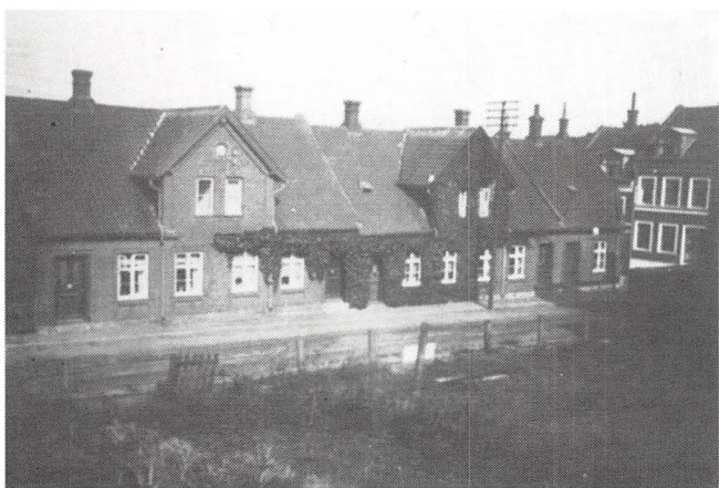
Ottosgade 1893, 1895.