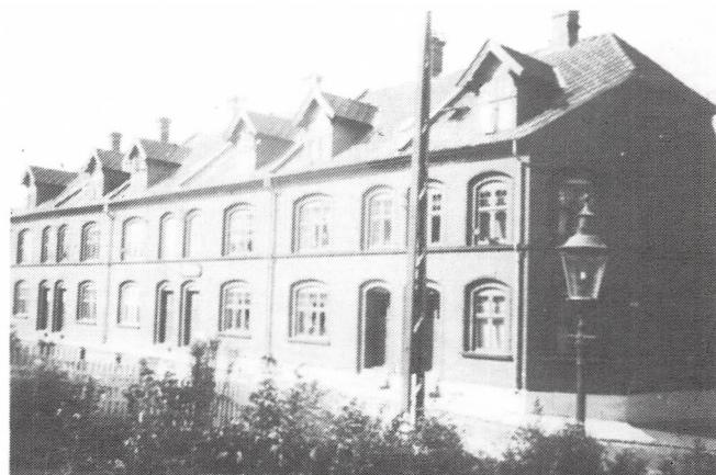
Mariegade 1904, 1905.

Men, siger formanden, det nytter jo ikke at bygge under sådanne vilkår, at man kun får to trediedele af lejen. De mennesker der skal bo i disse huse er middelstandsfolk.