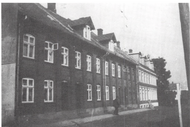
Utzonsgade 1900, 1902.