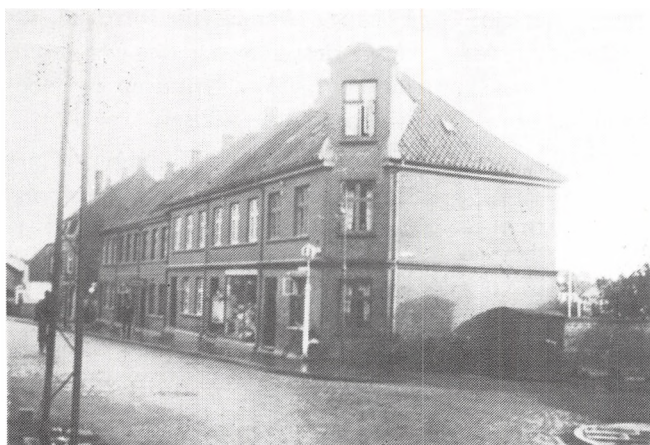
Sct. Jørgensgade 1884, 1887, 1890.