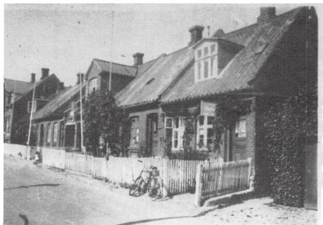
Søgade 1878, 1880, 1881.