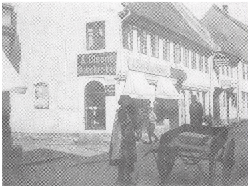
»Fønix«, Adelgade ca. 1900.