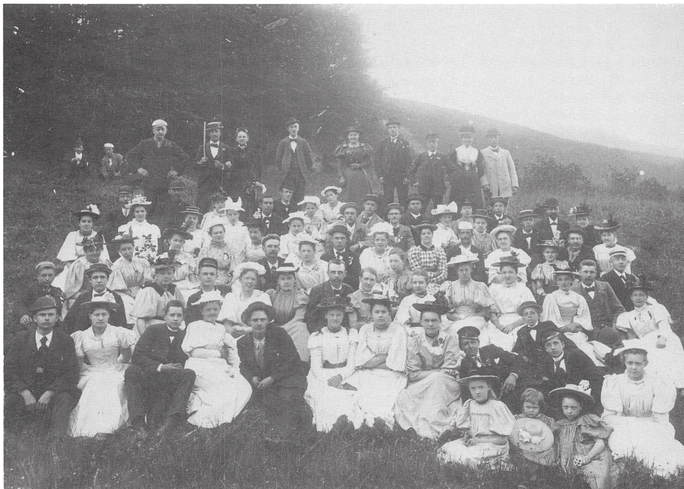
På udflugt med Kolding Ungdomssamfund ca. 1900.