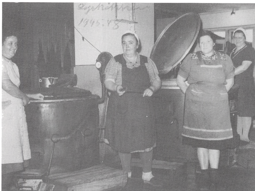
Køkkenet i Kløverlejren.

lin under krigen, men nu var han sendt herop som flygtning. Han var nazist, men han var dygtig til det der. Han havde et kontor oppe i Tvedvejlejr, hvor han lavede udregninger over kalorier. Det var sådan, at de skulle have 2500 kalorier om dagen, men det blev sat ned til 2000 fordi der kom klager fra Polen over, at de fik mere end polakkerne fik. Tyskerne lavede selv deres mad, det ville de helst, og så fik de naturalierne udleveret.