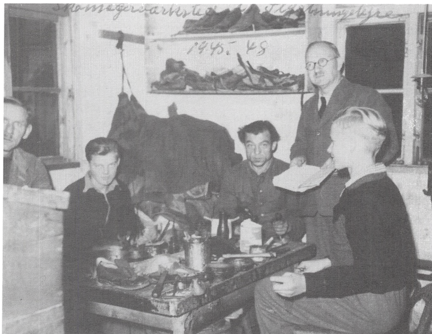
Skomagerværksted i Kløvervejlejr.

lign., så kom de altid til fordeling blandt børnene.