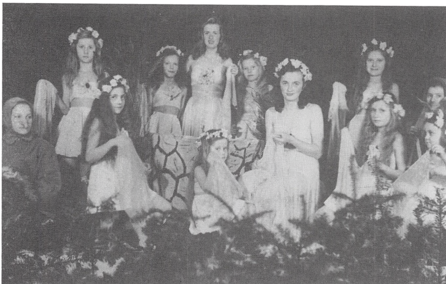
Teaterforestilling i Kløvervejlejen.

Præsten fra Sdr. Bjert var også vældig flink til at komme, han var allerede begyndt på det, inden jeg kom derud. Det betød psysisk meget for flygtningene, at der kom besøg.