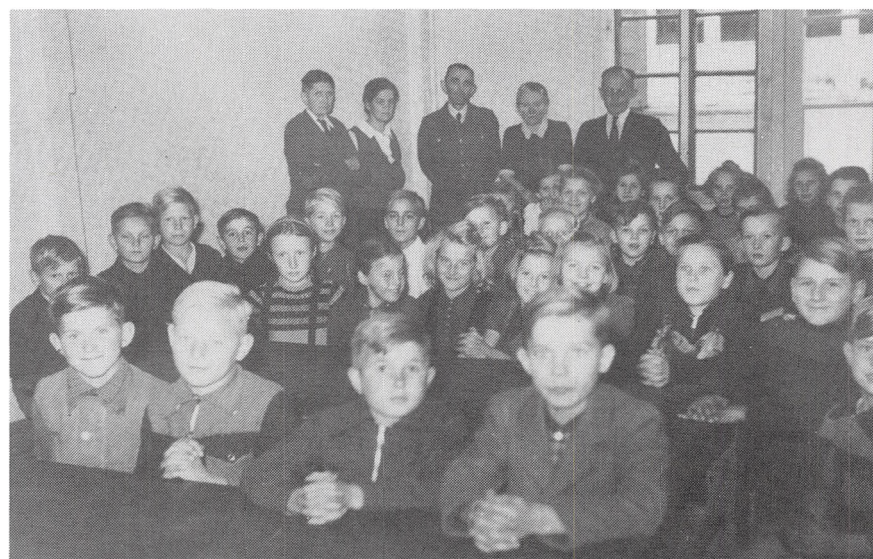
Skole i Kløvervejlejen.

Der var både læger og tandlæger i gruppen. En af lægerne, hun var kirurg, ville gerne have holdt det ved lige. Hun ville gerne op på