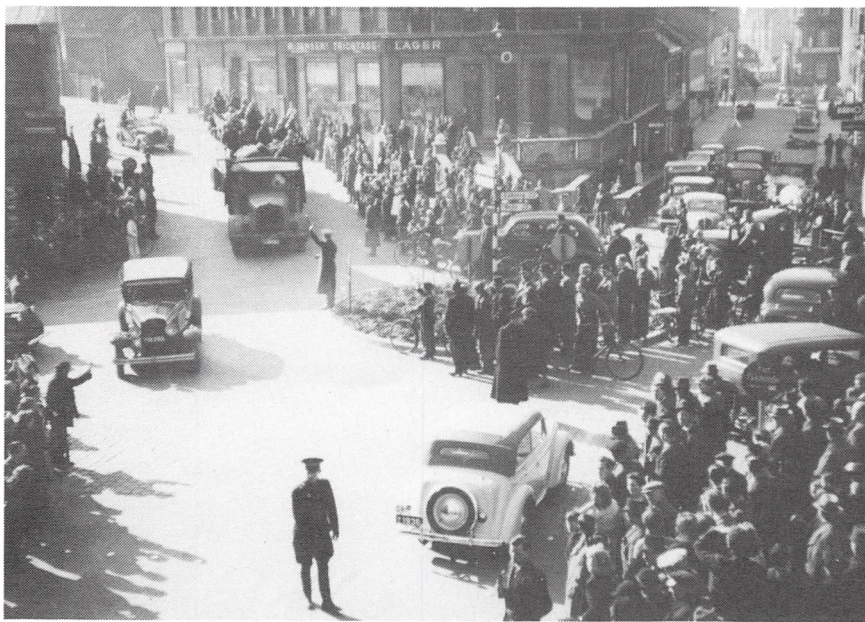
9. april 1940. Buen, Munkegade.

rebøger fra kursus og vi drak kaffe sammen.