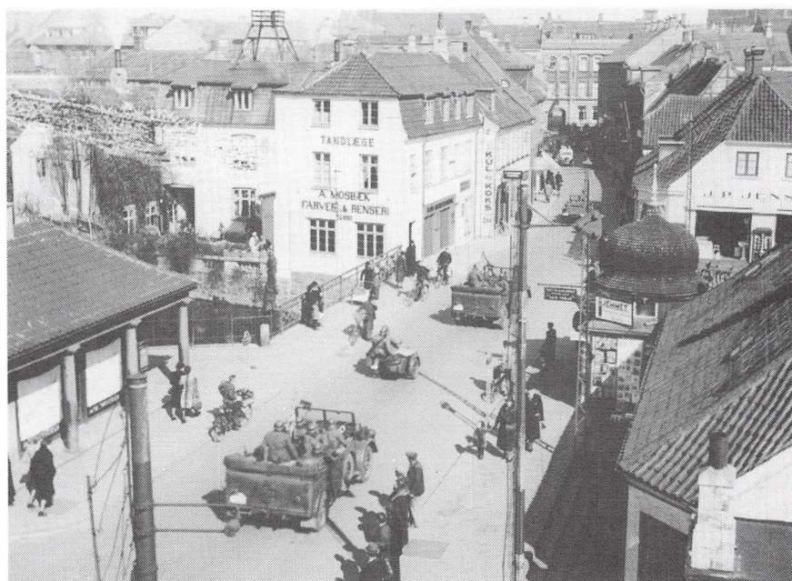
9. april 1940. Sønderbro.