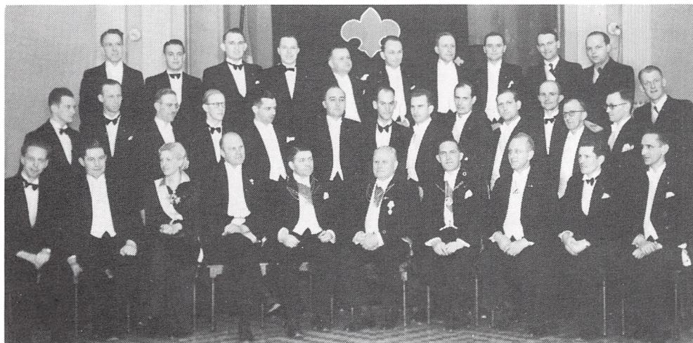
Ridderhallen i Kolding 1940.