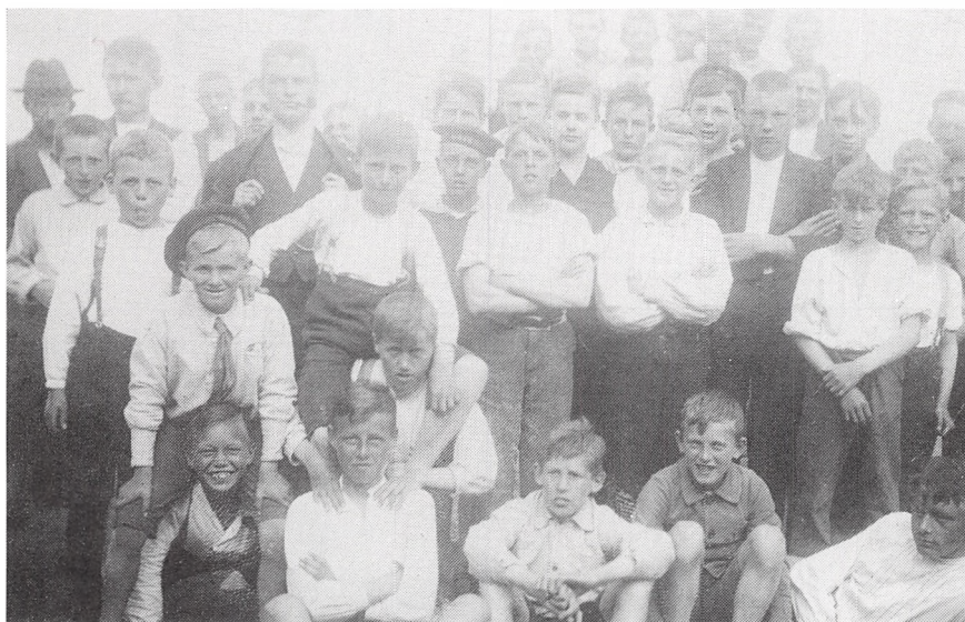
Drenge på Grønsborg i 1919.