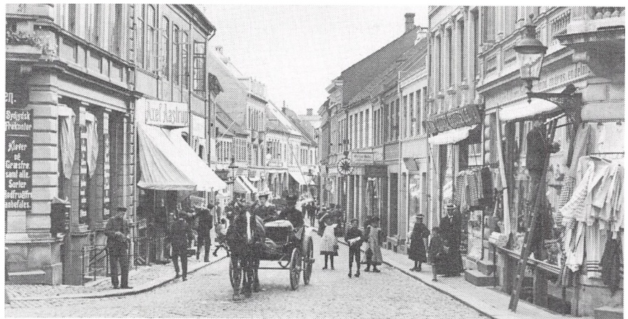
Østergade i Kolding omkring 1910. Nederst i gadens venstre side ligger Østergades Varehus, kaldet »Billigheden».