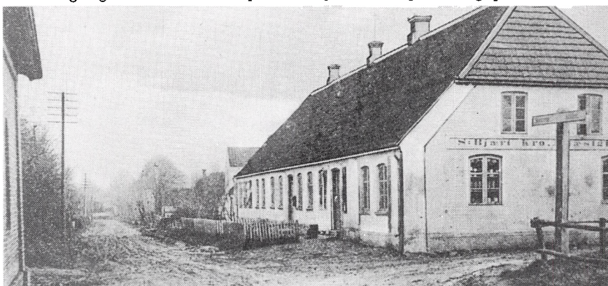
Bjært kro i gamle dage, før 1908. Til højre for døren er der købmandshandel, til venstre krostue og bagerbutik. Døren med postkassen fører ind til posthus og sparekassekontor.

Der hvor tømrer Falcks hus nu ligger, var dengang en stor urtehave med kartofler og gulerødder, men ellers var der masser af træ på grunden, og stabler af drittel-