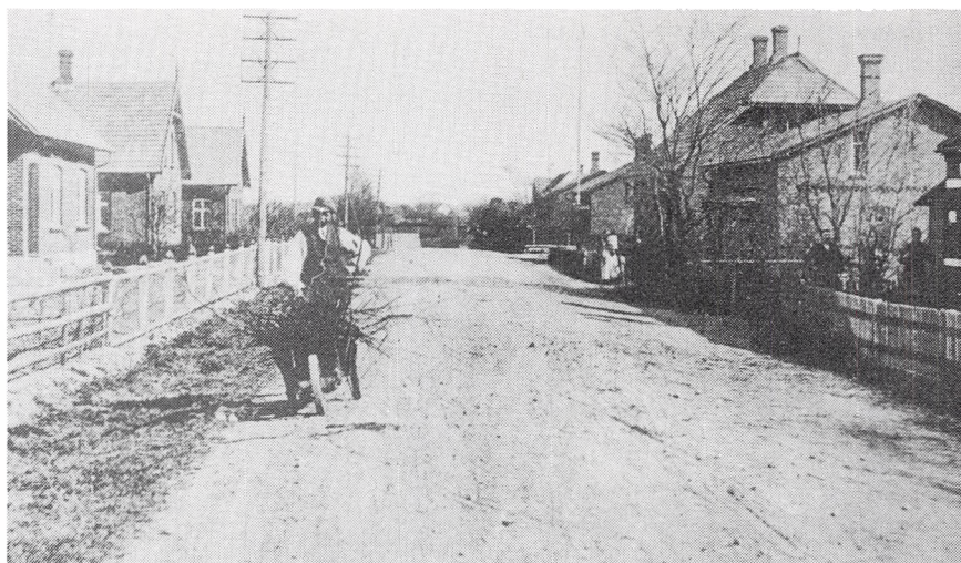
Parti fra Bjært stationsby.