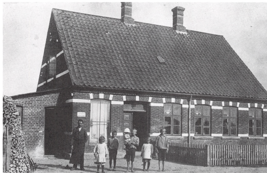
Sadelmager Andersens hus i Sdr. Bjært 1914.

Der blev altid arbejdet. Far stod ved sin skæreplanke ved vinduet til vejen og svendene sad og syede, og som regel stod en ved møbelarbejde, men det skete også, at de måtte af sted ud på gårdene for at reparere seletøj. Det var endnu brugt dengang, at håndværkerne gik rundt på gårdene med deres