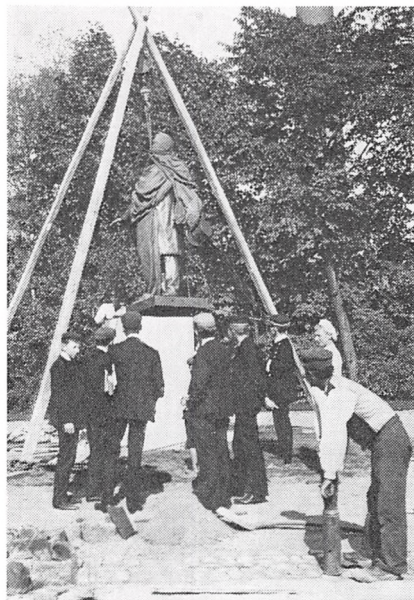
Monumentet rejses 1906.

På den afspærrede plads ved statuen tog komiteen, de indbudte og pressens repræsentanter plads. Og kl. 4 ankom »Brage«, Våbenbrødrene og bestyrelserne for de foreninger, der mødte med faner, i procession med musik i spidsen.