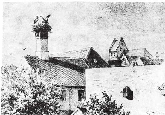
Storkereden på Rabens baghus, Østergade 22.