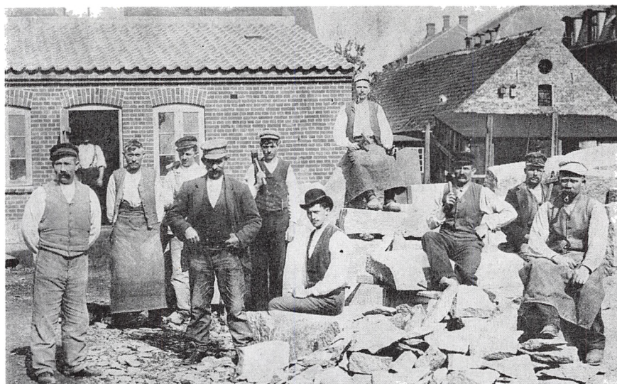
Ca. 1905. Forsbergs Plads i Nybrogade (Klosterstræde). I Baggrunden Vognmand Sloths Stald samt det øverste af Beboelseejendommen.

Af Indhugning af Skrift i Mindesten maa nævnes Oberst Læssøe, Carl Plougs Sten paa Slotsbanken, Peder Larsen Skræppenborg i Dons. 1909 blev en Stenbro anlagt over Aaen.