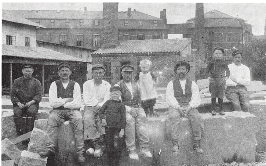
Ca. 1907. Forsbergs Plads. Til venstre bag Huggeskuret Holmsminde og i Baggrunden F.D.B.