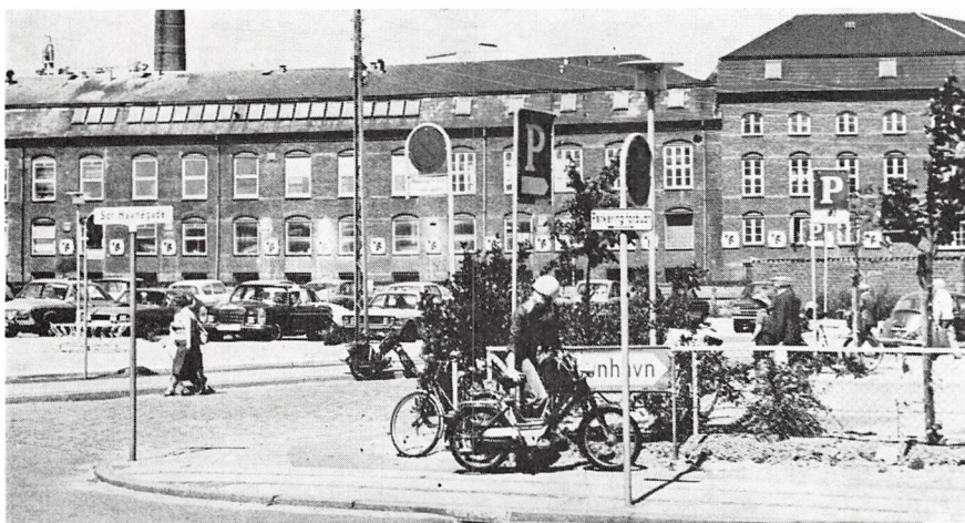
I Dag. Parkeringsplads, hvor tidligere »Holmsminde« havde Trævarefabrik. I Baggrunden F.D.B.

Omkring 1925 blev Døbefonten til Kristkirken udført i Faxe Marmor.