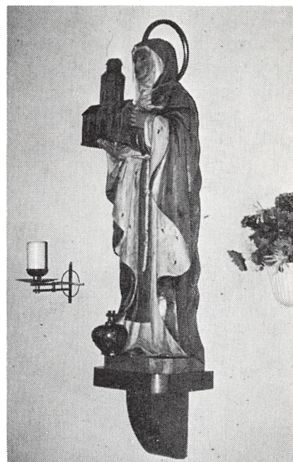
Den hellige Hedvig.

På et tidspunkt, da den offentlige sygehusplanlægning i Danmark kun i universitetsbyerne omfattede øjen- og øreafdelinger, kom Sct. Hedvigssøstre hertil og oprettede hovedsagelig