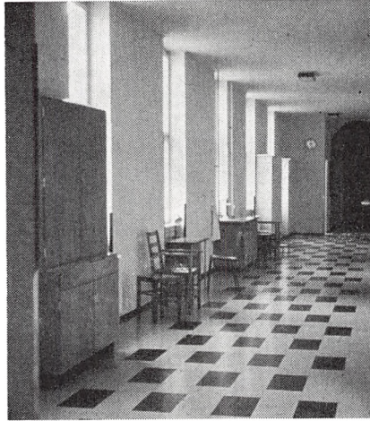
Gangen i hovedbygningens stueetage.

øreafdelingen til Vejle sygehus som et led i Centraliseringsplanerne for sygehuse i Vejle amt, og d. 9. september 1975 blev øjenafdelingen flyttet fra Sct. Hedvigs Hospital til Kolding store, nye sygehus bag Dyrehavegård. D. 1. oktober 1975 fulgte de ortopædiske patienter efter.