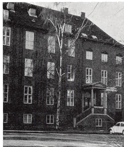
Indgangen til den første bygning i Domhusgade.