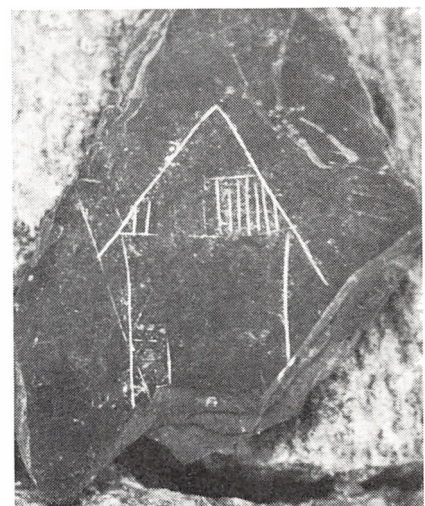
Indridset gavlhús af samme type, som husene på Rantzaus Kolding-prospekt fra 1580'erne, der ses til venstre herfor.

mave. Der er endnu tydelige aftryk af det vævede arbejdsforklæde. Vi fandt den i det nedbrudte hus fra omkring 1400.