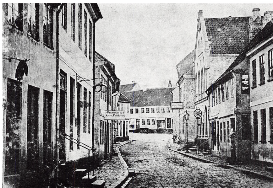
Østergade med Torvet i baggrunden. Ca. 1868.

Hvor har det dog været dejlige lykkelige arbejdsår. Alene det, at komme fra det flade fugtige landskab omkring Nakskov,