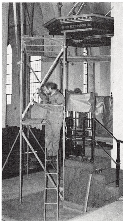
Nationalmuseets ekspert arbejder i kirken 1975.

Kolding, som udarbejdede dette store projekt.