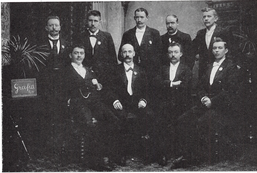
Medlemmer af sangforeningen »Grafiá«, der nævnes første gang i 1898.

sig, at behovet for lokalsygekassen ikke længere er til stede. Nævnes skal også initiativet med oprettelse af typografernes stiftelse i Søgade. Denne skønne bygning med 7 lejligheder indviedes i juni 1955.