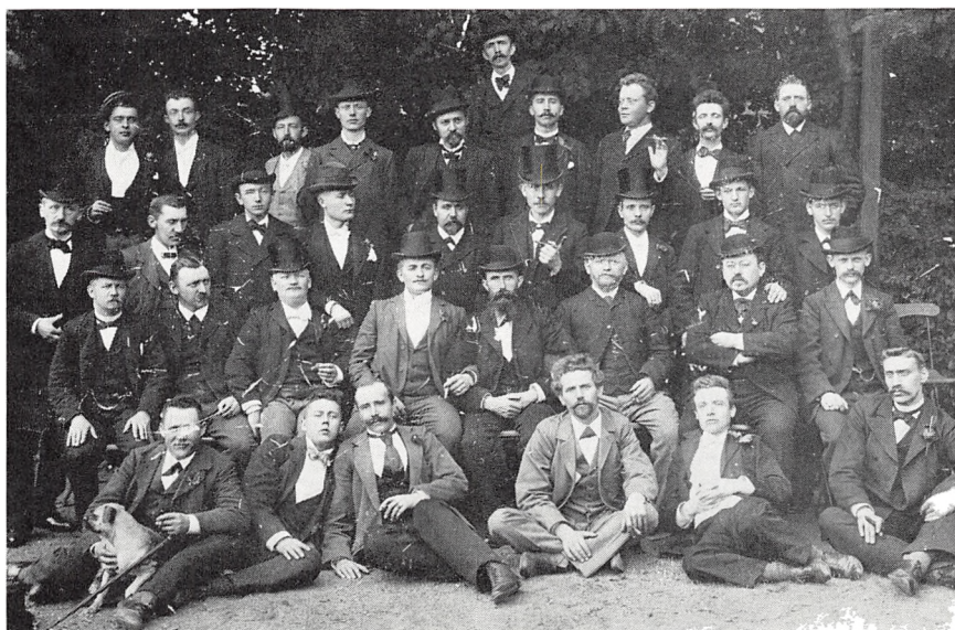
Typografer antagelig omkring 1890–1900.

I nyere tid stiftedes i 1919 typografernes lokalsygekasse for at bøde på de den gang meget små sygeunderstøttelser. Udviklingen har glædeligvis ført med