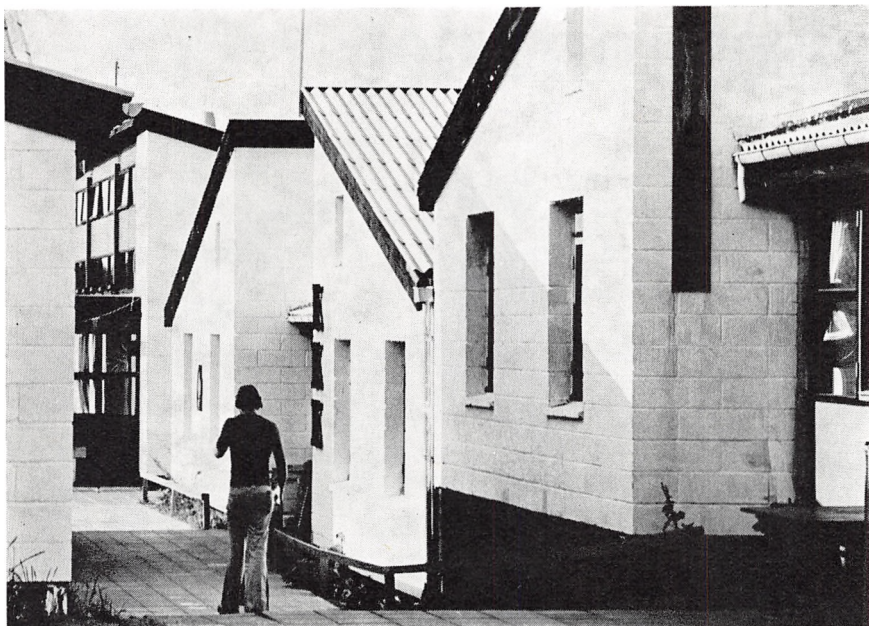
Gademotiv fra Kolding Højskole.

rørt af projektet. Endvidere har arbejdsgruppen samarbejdet med og løbende orienteret kommunens forskellige afdelingschefer for herigennem at få koordineret