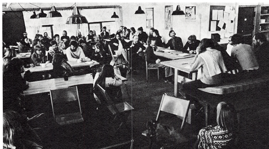
Fællesmøde for alle på højskolen.

Det er store ord, og mange vil i den anledning kalde os frelste og ensporede. Det føler vi ikke selv vi er. Vi har mange problemer at slås med, og vi løser dem ikke godt nok. Men det at være på højskole er en læreproces — både for kursister og medarbejdere.