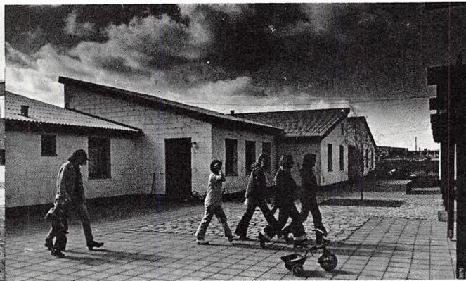
Højskolegaden mellem kursisthusene.