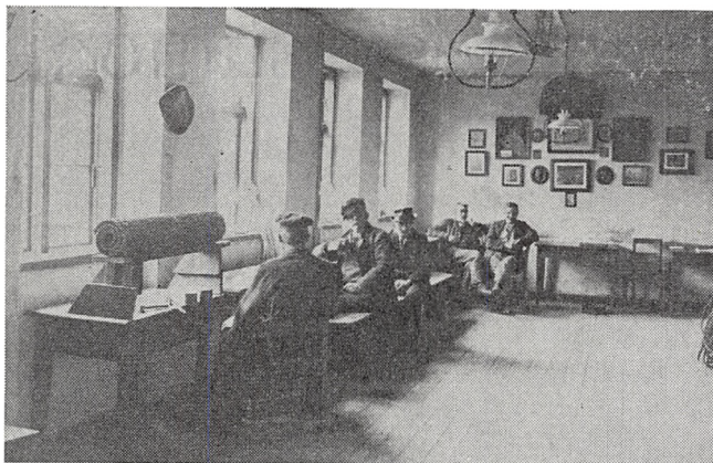
Den kombinerede arbejdsal og dagligstue i Koldings sidste fattiggård.

Under opholdet på fattiggården arbejdede de indlagte ved forefaldende arbejde i køkken, vaskehus og have. Andre klistrede poser til brug i forretningerne. Det fore-