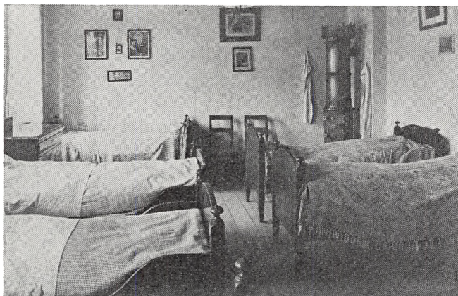
Kvindernes sovesal i den tidligere friskoles bygning.