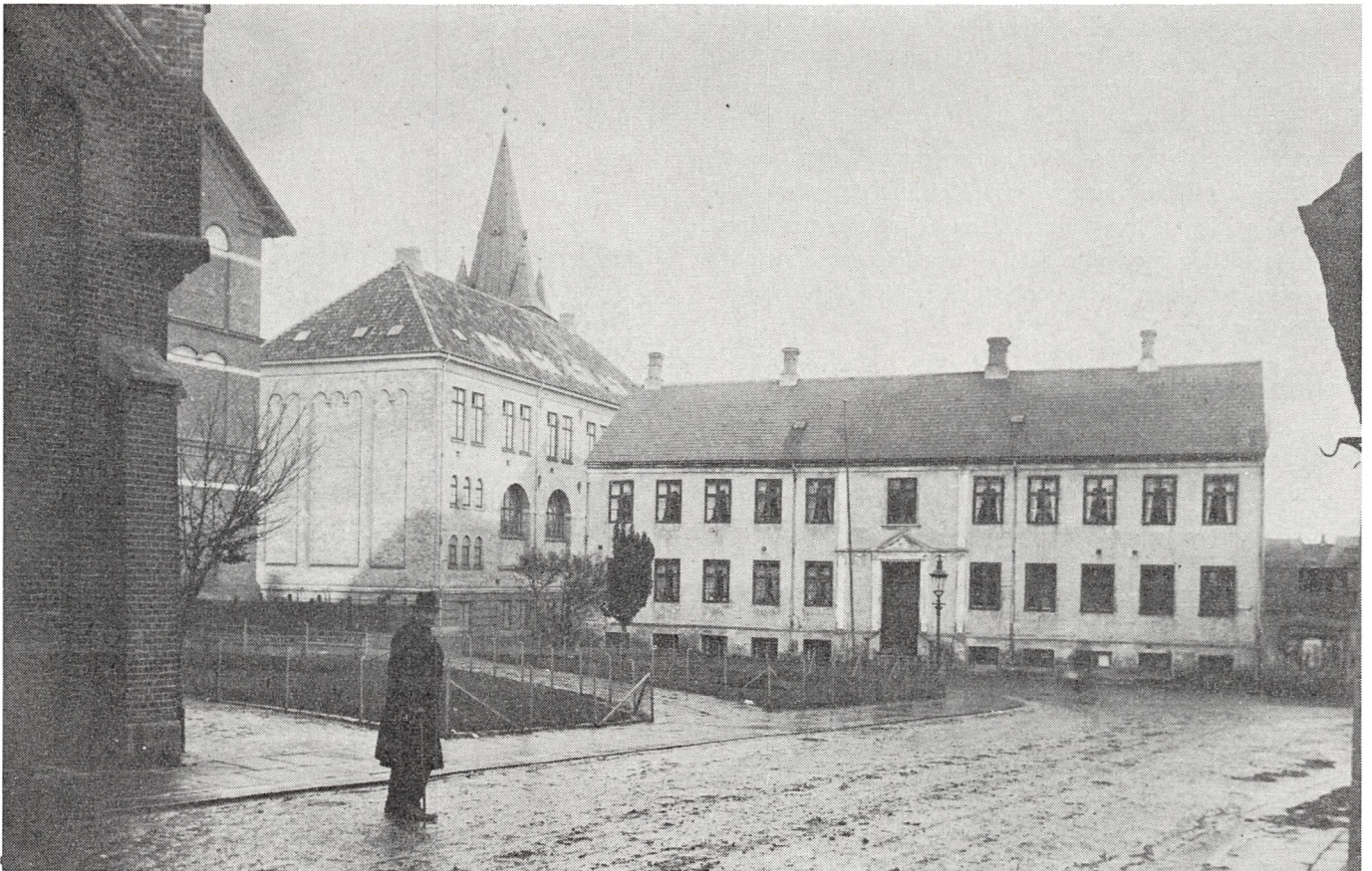
Koldings sidste fattiggård, der endte sine dage som rutebilstation med tilhørende café. Da bybus-terminalen blev oprettet, forsvandt den gamle fattiggårds sidste bygninger.

Hvor mange fattiggårde, Kolding i tidens løb har haft, fortæber sig i det uvisse. Af P. Eliassens Kolding-bog fremgår, at de spanske hjælpetropper, som i 1808 var stationeret i Kolding – og blev skyld i Koldinghus' brand – benyttede den daværende fattiggård, også kaldet »Krankhuset«, det vil sige sygehuset, som militærlazaret. Det lå for østenden af Klostergade, dér hvor nu jernbanen bag et stakit passerer gaden. Denne bygning blev i 1830 af fattiggården magelagt med det gamle bindingsværkrådhus på Akseltorv. Det gamle rådhus blev nedrevet og materialerne brugt til at opføre et »Arbejds- og fattighus«