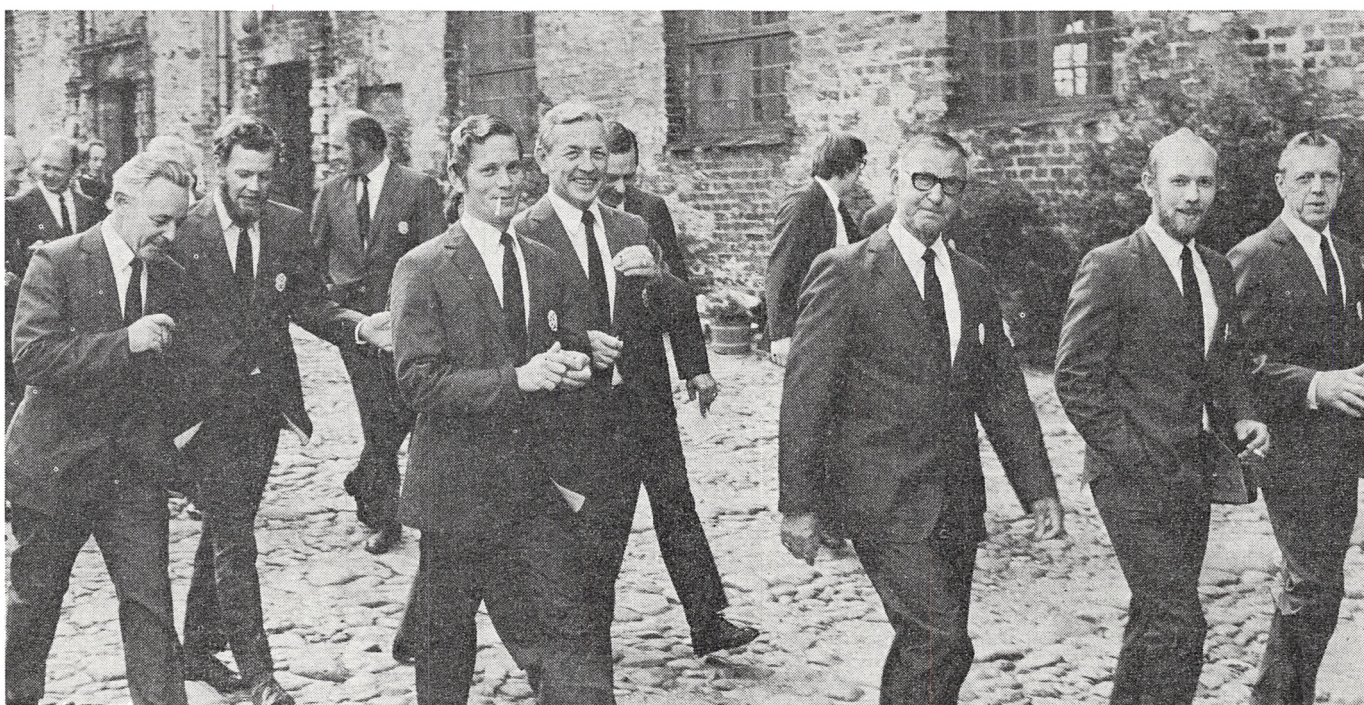
På det verdslige plan er Kolding Mandskor blevet den lokale triumf ved lysfesterne på Koldinghus. Her er de muntre musikanter på vej gennem slotsgården.

I Kolding Mandskor er der ingen onde ord eller vred tale, men prøverne ligner enten en boksekamp eller en kærligheds-film.