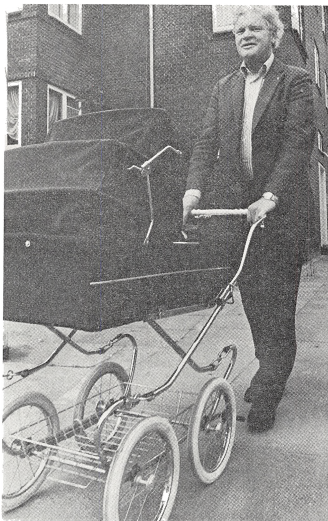
Elmo er ude at trille med barnevogn. Formodentlig har han kidnappet en brysttenor til senere brug.

I sit 39. år havde koret en 20 minutters udsendelse, »Folketoner fra flere lande«. Public skrev da i Folkebladets »talerstol«: »Jeg synes, det er en god titel, og udsendelsen må jo siges at være produceret på det helt rig-