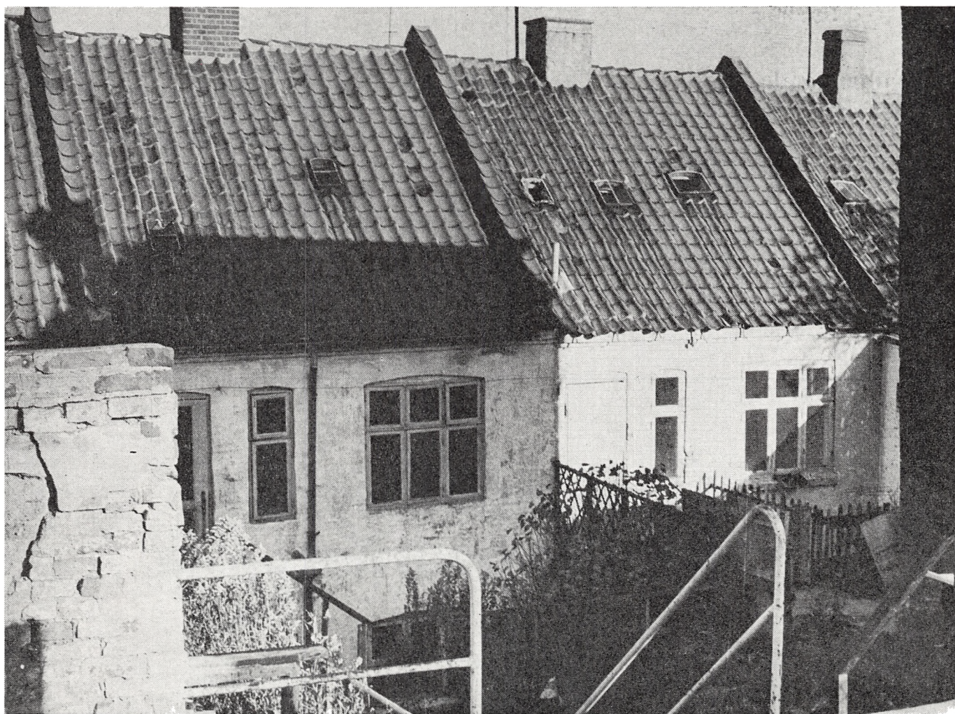
For romantiske sjæle: Allégade set fra Lergravsstien.