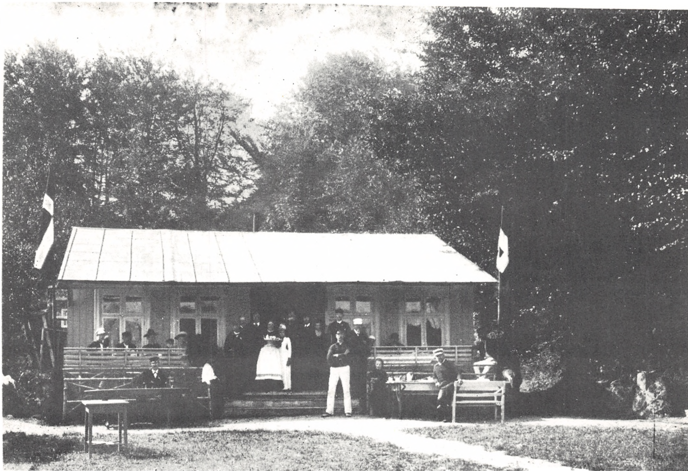
"Christiansminde" omkring 1890

de mystiske ting, der fandt sted ved disse møder – det meste var vel nok kun gisninger – og i de lokale sommerrevuer måtte de gæve ålespisere da som regel også stå for skud. I et vers hed det: