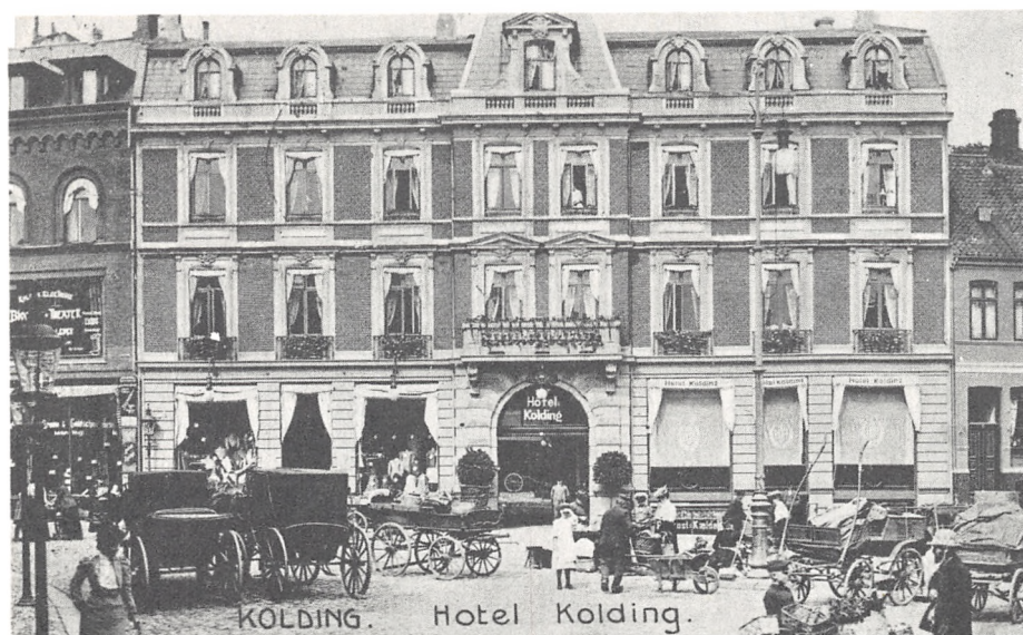
På torvet holdt hyre-droscherne.