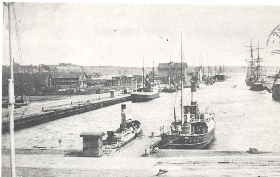
Afgang med fjordbådene til "Christiansminde"