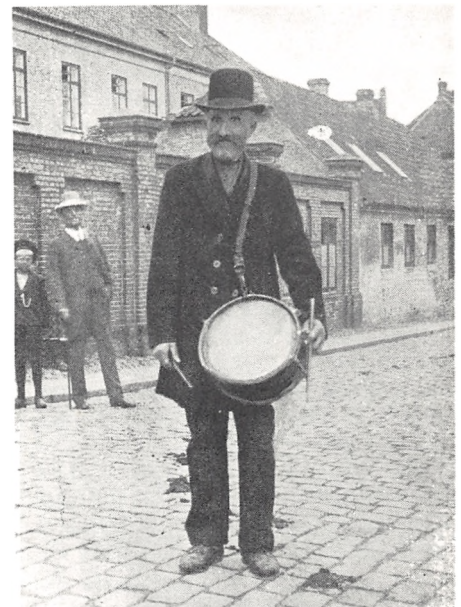
Sviiegade - nu Sviatorv - hvor trommeslageren averterede kommende begivenheder for al folket.