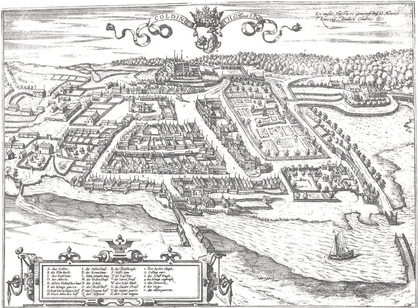
Kolding i Frederik II's Tid.