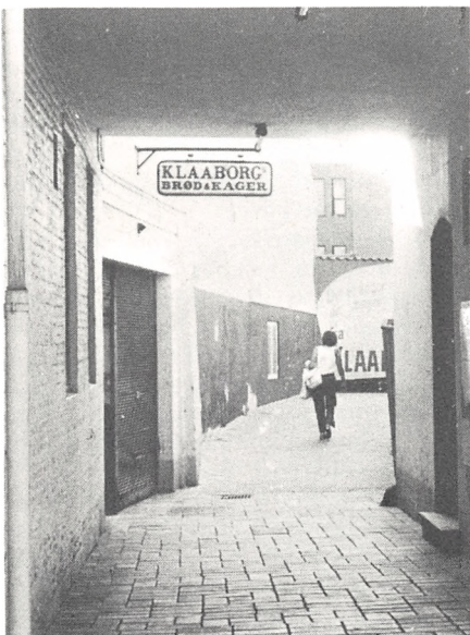
"Katsund", som det ser ud i dag. Her er stadig gennemgang, men strædet er moderniseret, og på det ene hjørne er nu en "pub" i engelsk stil

På ganske samme måde stiller det sig med oprindelsen til navnet "Blæsbjerg". Det brugtes i middelalderens slutning og findes på Rantzaus kort som betegnelse på et enkelt stort hus. Der er fremsat den