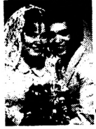
Bryllupsfotografering efter aftale