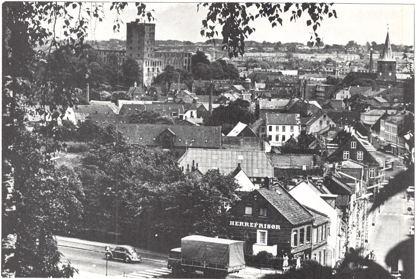
Et vue over den gamle bydel af Kolding omkring Låsbygade-Nørregade. Det er Nordre Ringvej, der skærer igennem i bunden af billedet.

De er altid velkommen til at se det nye i