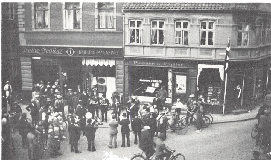
»Det er min fødselsdag i dag - «