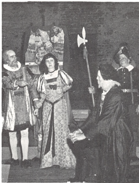
Bygmester Strange er faldet på knæ for lensmanden og beder - forgæves - om nåde for sin søn

Du, Blegnæb, jager ud den gamle skalk med samt hans svende fluks af Kolding by hver køter skal ad denne bande gå, som aldrig her skal stjæle slottets kalk og slottets herskabs gode navn og ry